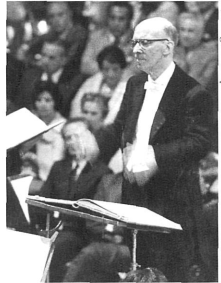
J. Roig / L'Independent