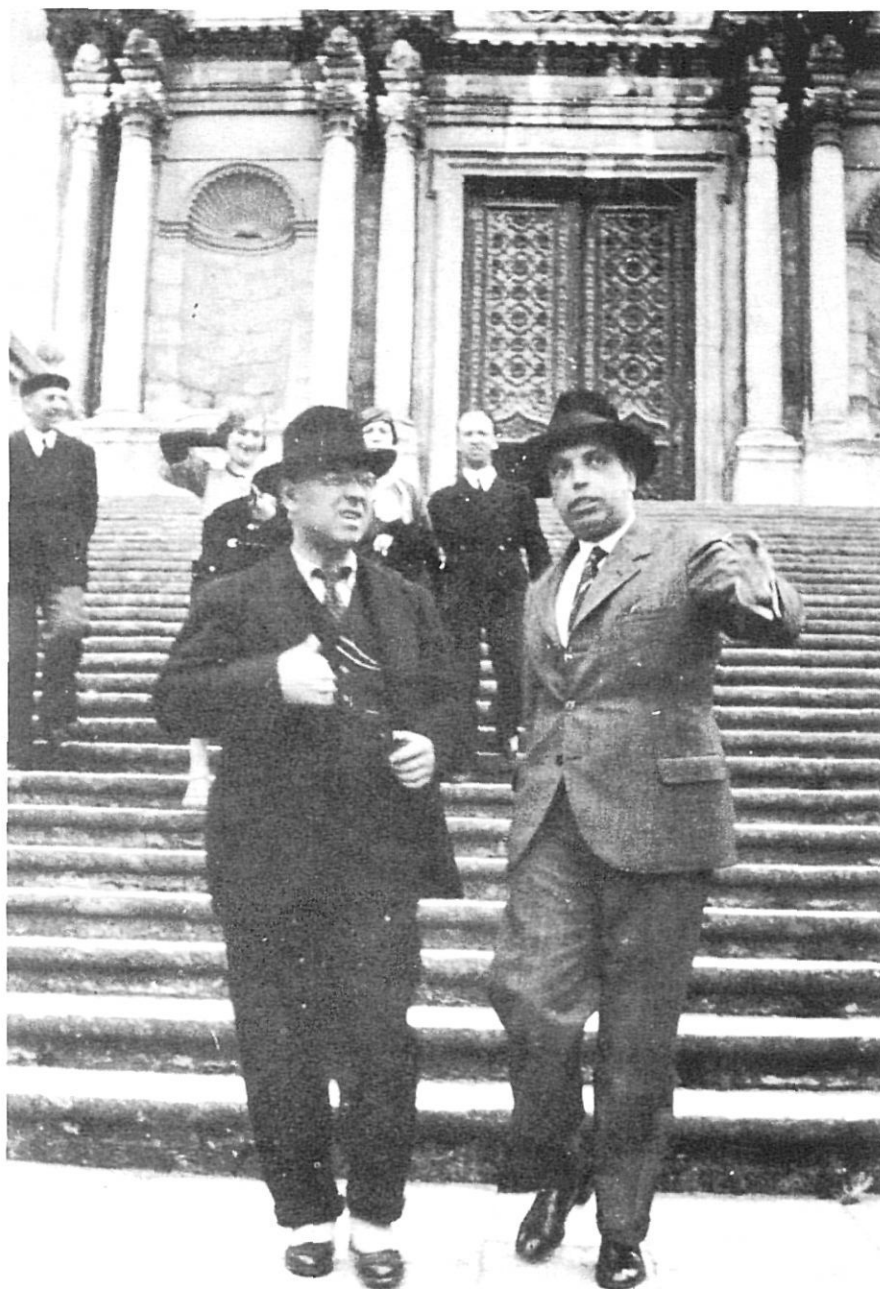
Pau Casals i Josep Tharrats a les escales de la Catedral de Girona, l'any 1933.

El curs 1922-1923 es fundà a Girona l'Associació de Música, a l'ombra de la Casa Sobrequés, que ja s'ha estudiat degudament des d'aquestes pàgines (1), i el concert de cloenda del segon curs d'activitats de l'esmentada associació va anar a cura de l'Orquestra Pau Casals, el dia 24 de juny de 1924. El ressò d'aquesta primera presència a Girona el tenim perfectament recollit per Tomàs Sobrequés a la revista Scherzando , una publicació a la qual s'ha de recórrer obli-