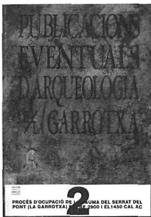
Col·lecció Publicacions Eventuals d'Arqueologia de la Garrotxa. Museu Comarcal de la Garrotxa. Olot.