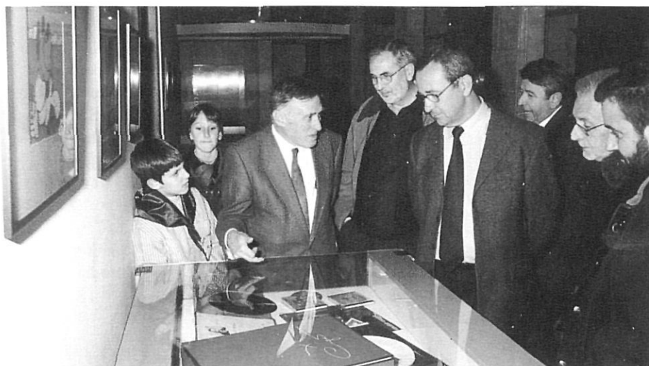
Inauguració de l'exposició "Del carrer del Sac a Beverly Hills".

El seu retorn a Nova York va suposar el seu darrer intent de tenir un lloc entre els intèrprets de violí i esdevenir un successor del seu admirat Pablo Sarasate. La