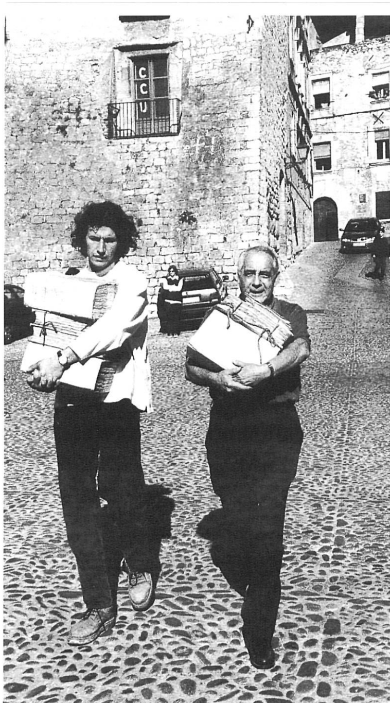
El responsable de l'Arxiu Diocesà i el seu ajudant traslladen lligalls del carrer de Bellmirall al Seminari.

abans de deixar-te consultar res, t'entrevisten i et demanen qui ets, amb què o qui treballes, sempre amb aquest afany orientatiu i de servei.