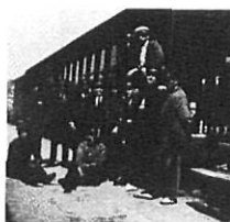
Grup de treballadors a Sant Feliu de Guixols (1912).