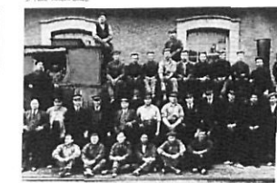
Grup de treballadors a Sant Feliu de Guixols (1912).