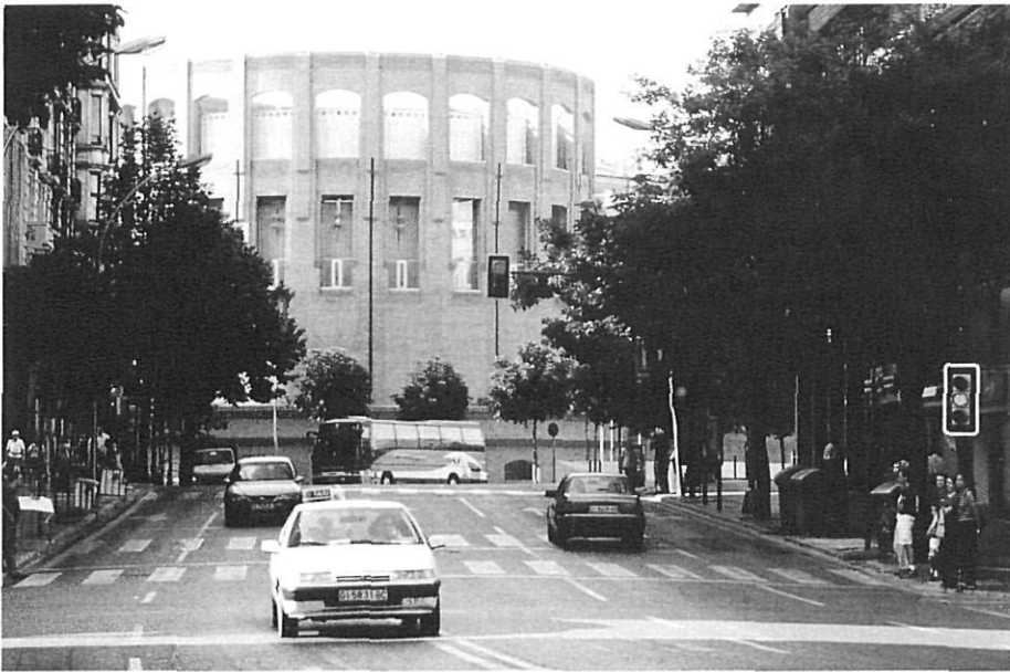
Banc d'Espanya, l'estètica dels vuitanta (1984-1989).