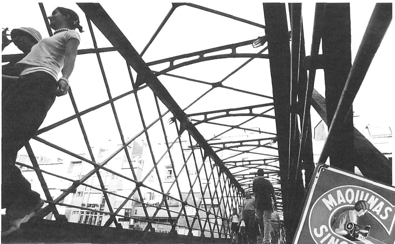
El pont Eiffel, la modernitat avant la lettre, entre la Rambla i el carrer Nou (1877).

Catedral goticobarroca, acaronada pel silenci de la nit, sura dins un cel de formol il·luminat pels fanals; on el rellotge de la torre pren una carnalitat fosforescent, inopinada; on la cocollona (meitat cocodrill i meitat papallona, una monja empresonada injustament convertida per la divinitat per poder fugir del cau en un ésser fantàstic digne de l'Spielberg) sembla tornar del seu oblit de segles, i on les gavines, com animals mitològics desproporcionats, desafien, majestuosos, les lleis de Newton (hi ha un moment etern quan es mira una gavina en ple vol en què sembla que l'aire deixi d'existir, que hagi —literalment— desaparegut del seu voltant i que el temps no sigui un paràmetre tangible, real). La postal, per una vegada, ha vençut la realitat.