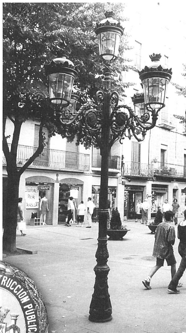
Els fanals de la Rambla, arbres voltaics (1916).

No es pot dir el mateix de les —presumptament— majestoses àguiles imperials que ens parlen d'un Estat gris, totalitari i repressor, tan estimades per la dictadura nacional-sindicalista del general Franco. En el cas de la foto, l'àguila amb al·lumino-si decora un edifici d'habitatges militars prou degradat de la pujada del Castell, a Figueres, però tothom ha vist —molts hi passen cada dia per sota— els plafons del Ministerio Nacional de la Vivienda als portals de les "cases barates", de les cases de protecció oficial, amb el yugo y las flechas falangista que segella els somnis urbanístics del desarrolismo i l'especulació que tants estralls va provocar al patrimoni històric de Girona. Un ideari que Narcís Comadira va definir prou explícitament al seu llibre