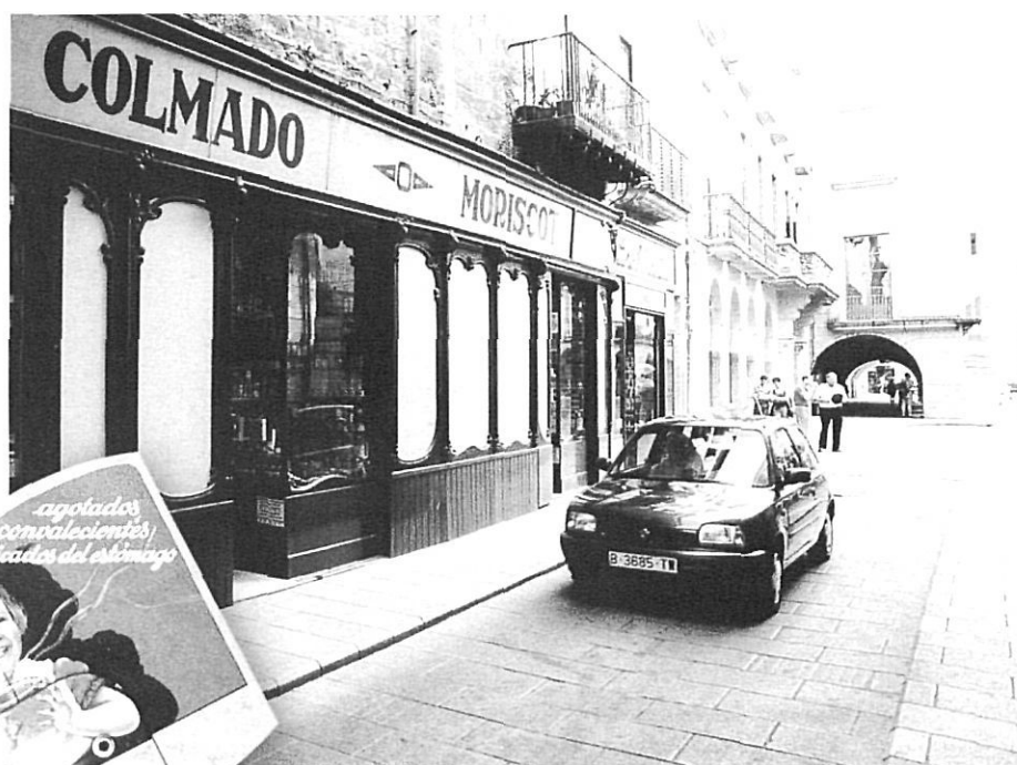
Colmado Moriscot, carrer Ciutadans, núm.4, el paradís culinari modernista (des de final del segle XIX; actual propietari, des de 1959).