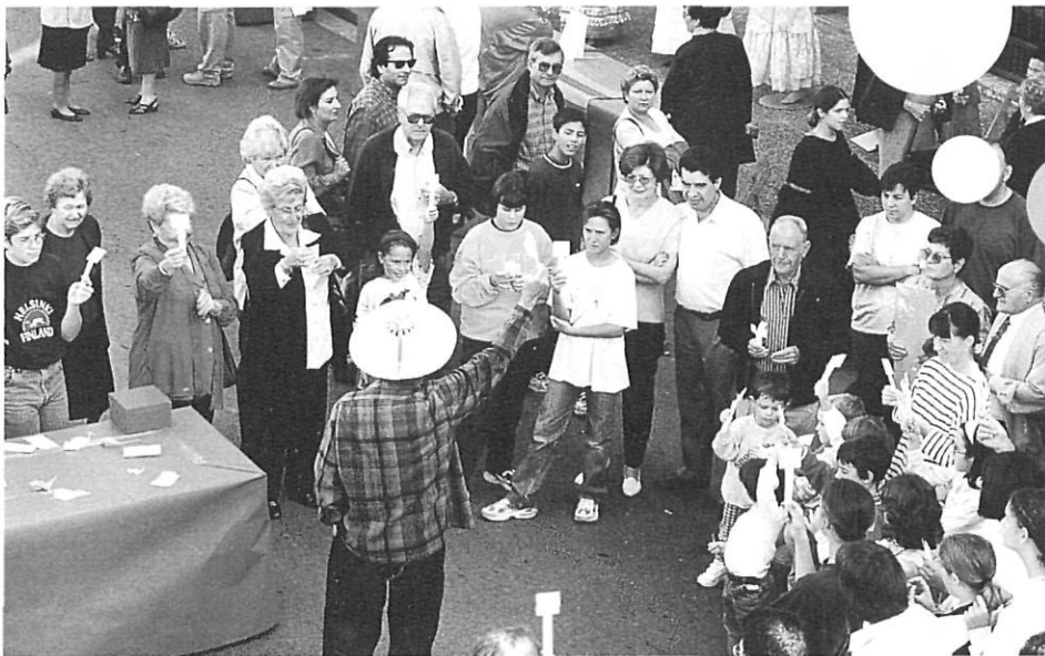
Dues imatges del Mercat del paper de Sarrià de Ter.

La importància històrica del sector paperer a Girona s'evidencia quan hom veu el vídeo Molins i fàbriques de paper a les comarques gironines , en el qual es posa de relleu la necessitat de l'aigua com a factor de localització i es fa un inventari dels molins de paper establerts a les conques dels rius Ter, Fluvià i Terri. La majoria resten dempeus, malgrat la indefensió i manca d'atenció institucional en què es troba el patrimoni industrial. Durant la segona meitat del segle XIX el districte industrial gironí va ser capdavanter a Catalunya quant a la introducció de les màquines de paper en continu, la qual cosa va comportar la desaparició de l'activitat artesanal dels molins de paper. Amb l'exposició de fotografies «Una mirada al nostre passat industrial», s'ha ofert una selecció d'imatges del període 1950-1975, provinents en la seva