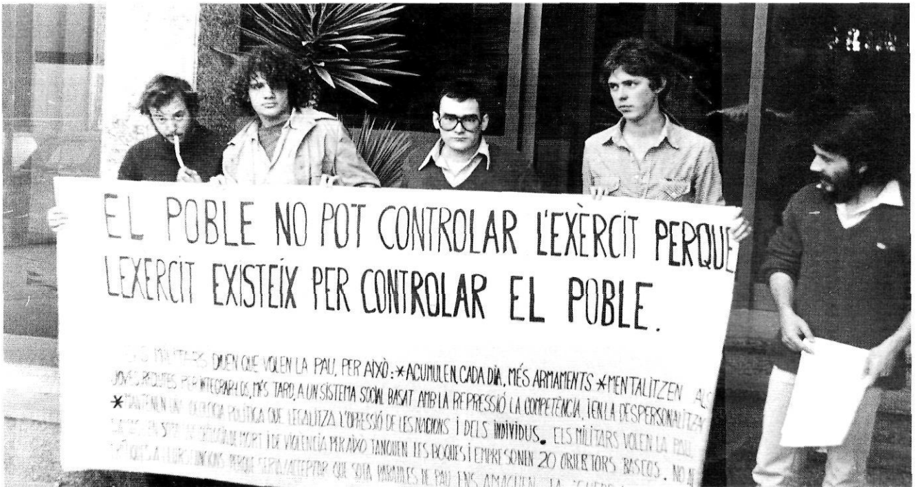
Pancarta d'una manifestació antimilitarista a Girona.