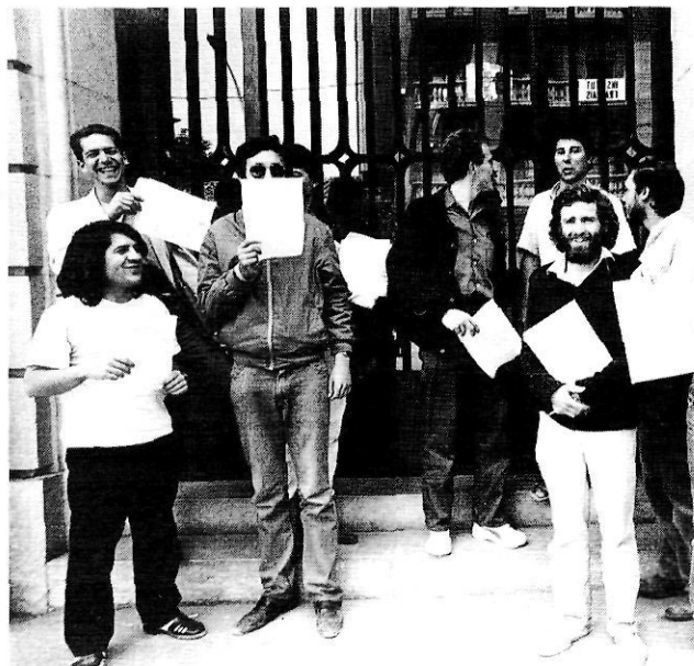
Concentració d'objectors davant el Govern Civil de Girona, l'any 1985.

i de mentalitat expressen un rebuig a la conscripció obligatòria. El debat, realment, ni tan sols s'ha fet de forma generalitzada, sistemàtica o prou argumentada. La suma de positives raons de pes cultural, social i polític barrejades amb oportunismes de diversa mena han conduït la legislació per la via ràpida cap a l'extinció del vell model d'inspiració liberalrepublicana del «poble en armes», tot constituint-lo, encara no sabem amb quin èxit i amb quins efectes econòmics i socials discutibles, per la professionalització dels soldats.