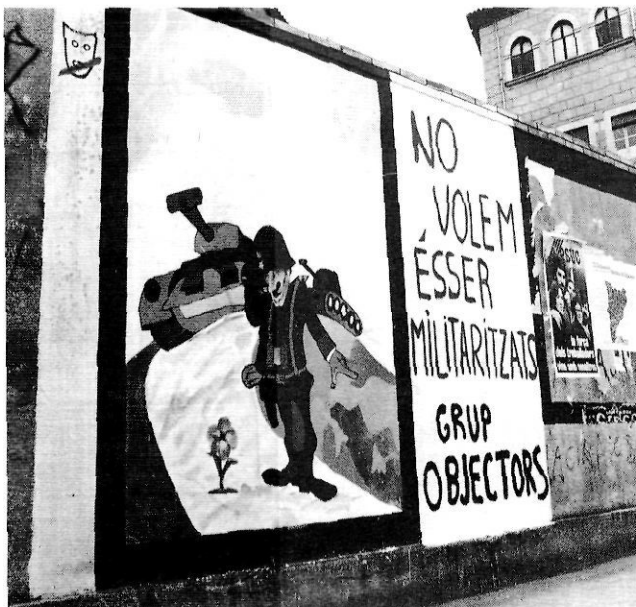
Pintada mural a la Gran Via de Girona, 1979-1982.

fantasmes d'una banda i, de l'altra, l'actitud gasiva d'algunes institucions que acostaven perillosament –perquè era il·legal– la funció del prestador social a la de la mà d'obra barata.