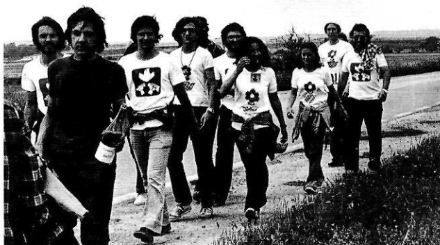
Marxa d'objectors sobre Figueres.

sió— del servei militar; és a dir, cap al distanciament social d'una sacralitat militarista i autoritària i, a la llarga, cap a l'afebliment de la tradició social de la mili tal com s'havia conegut durant dècades. La legislació de l'objecció de consciència arribava tard —i en mal moment, després del cop del 23-F— i limitada per als més progressistes, però resultava desconeguda i en principi innecessària i fins i tot excessiva per a sectors socialment i territorialment —però no sempre ideològicament— més tradicionals de la societat espanyola. La timidesa del govern i del grup parlamentari socialista —que s'expressava en la part penal, en la prohibició de l'objecció sobrevinguda i en la llarga durada de la prestació social— responia més a una mena d'inseguretat, entre ideològica i econòmica, per una pèrdua ràpida del model tradicional i constitucional del servei militar obligatori que a una voluntat limitadora dels que es podrien considerar com a drets raonables dels objectors. Amb tot, cal dir que la legislació comparada no feia quedar malament, en termes globals, la nostra llei; només Àustria i Holanda es podien considerar més obertes, però França o Itàlia, per exemple, eren clarament més dures.