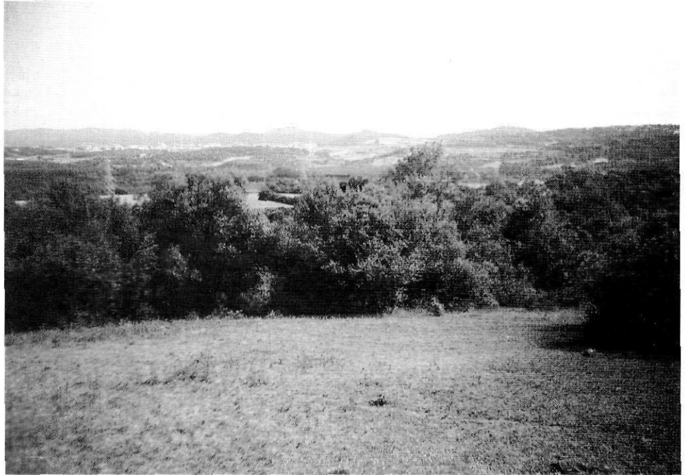
Visió general de tota la sèrie de turons de Maçanet, des de Puigsardina. Aquests turons tanquen pel sud la depressió selvatana; molts d'ells són volcànics però només uns quants es troben dins de l'àrea PEIN. Al peu, el nucli urbà de Maçanet de la Selva.