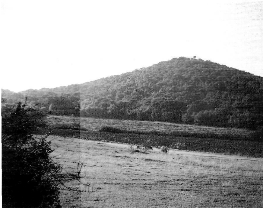
Visió general del turó de Sant Jordi, un dels més representatius de la zona per la seva peculiar forma cònica que recorda el seu origen volcànic, el qual es remunta a uns 5-7 milions d'anys d'antiguitat.

plantacions, prats, camps de conreu, zones humides temporals...) i per la combinació d'elements de la fauna mediterrània i centreeuropea en un mateix espai. Malgrat aquesta aparent riquesa i singularitat, diversos factors afecten negativament la seva conservació com són: la manca de zones aigualoses per als amfibis, l'impacte generat per les activitats extractives (soroll, pols, freqüentació humana, eliminació de la coberta vegetal...) o la pressió humana exercida per les zones urbanitzades del voltant i la xarxa viària, causa de la pèrdua d'antics hàbitats naturals i de nombrosos atropellaments.