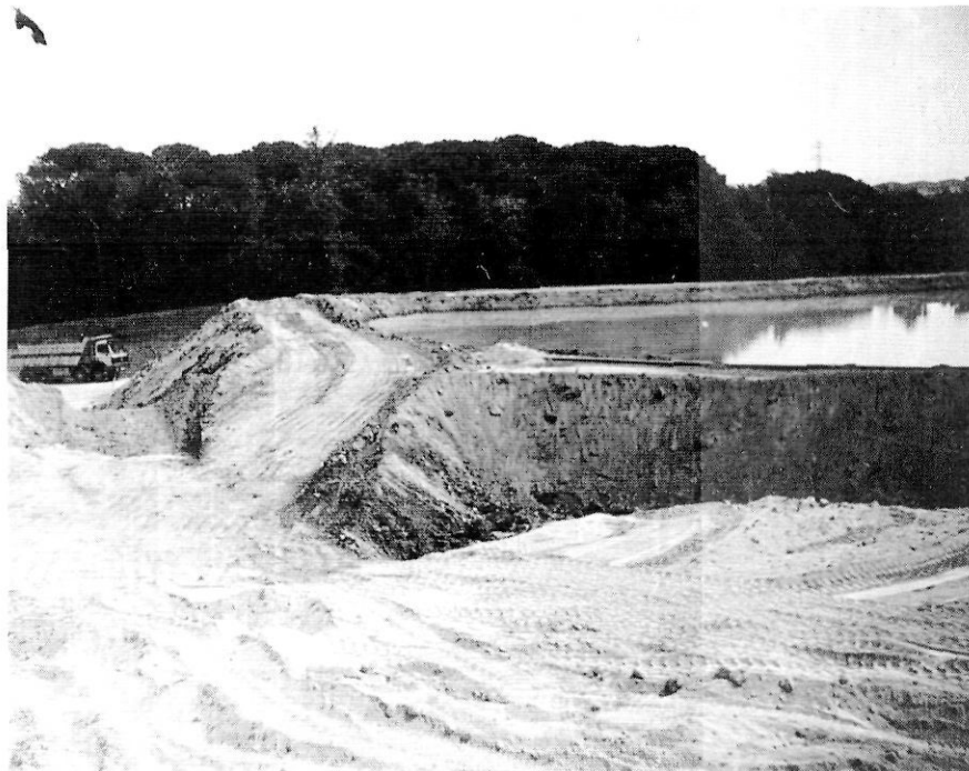
L'espai antigament ocupat per la roureda mixta (amb alzines) ara és ocupat per una bassa habitada per afavorir el tractament dels materials extrets. Sorrera de Mas Sabater.

Els Turons de Maçanet s'inclouen dins la zona on la vegetació dominant és la de tipus mediterrani, però amb petits enclavaments de vegetació més propis de l'Europa humida, fruit d'unes condicions microclimàtiques concretes. Respecte a la vegetació típica mediterrània, estaria representada, fonamentalment, per boscos escleròfil·les de frondoses