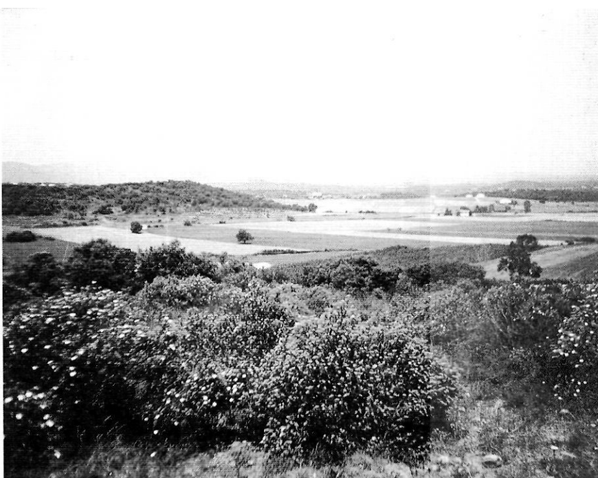
La presència dels turons al costat mateix de la depressió selvatana afavoreix l'efecte mosaic, ja que hi ha una major variabilitat d'usos del sòl en una superfície reduïda. Així, s'alternen els conreus de la plana, amb zones boscoses o brolles que apareixen a les àrees més esclarides. Al fons, el massís de les Guilleries. Turons de Cal Roure.

En comptes d'apostar per un espai protegit únic més ampli, s'ha defensat un posicionament basat en la fragmentació dels espais naturals prote-