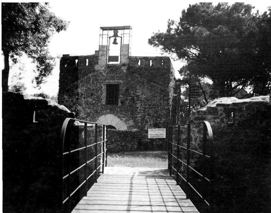
Conjunt de l'ermita torre de Sant Jordi i del seu fossat, aixecat al cim del turó del mateix nom. El conjunt fou restaurat fa molt poc temps i és una de les operacions més significatives que ha permès la recuperació per a ús social de part del patrimoni historicoarquitectònic local. Des de dalt de l'antiga torre de telegrafia (o ermita) és possible fruitir d'una de les panoràmiques més àmplies dels turons de Maçanet.

forests, al llarg del temps, a les exigències del mercat: carbó, llenya, suro, botada, fusta, etc. Pel cas de l'àrea que ens afecta, la dimensió força reduïda dels turons (Puigsardina o Sant Jordi) o el fort pendent (Buscastells) han fet més difícil el seu aprofitament forestal. En aquests casos, el bosc ha estat utilitzat, bàsicament, en l'àmbit familiar, ja sigui per a fer llenya i anar de cacera o com una mena de «guardiola» que es pot utilitzar en moments de necessitat. Al turó de Buscastells i a un petit aflorament granític del turó de Puigsardina, l'explotació del suro denota l'afavoriment que ha rebut aquesta espècie en detriment de l'alzina.