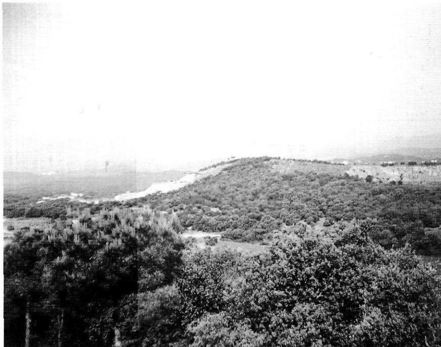
Turó de l'Oller, un dels turons volcànics no inclòs dins de l'àrea PEIN. A mà dreta, una pedrera ja clausurada. A l'esquerra, la pedrera de Cal Rei, encara en actiu. Es poden observar els efectes que ocasiona aquest tipus d'impacte sobre el relleu i la vegetació. Fotografia presa des del turó de Sant Jordi.

(sobretot arbustives i herbàcies) la presència de les quals ha estat afavorida directament o indirecta per l'ésser humà i que ajuden a garantir el major grau de diversitat i variabilitat d'espècies a la zona. O sigui, de la mateixa manera que es pensa que els boscos autòctons d'aquest espai no han de desaparèixer, també es creu que no és convenient que envaeixin l'espai que avui és ocupat per les brolles o els prats: el manteniment de l'efecte mosaic és positiu, i activitats com les pastures no intenses hi poden contribuir favorablement.