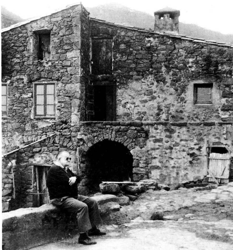
Narcís Puigdevall davant l'Hostal de la Muga, a l'Alta Garrotxa, l'any 1992.