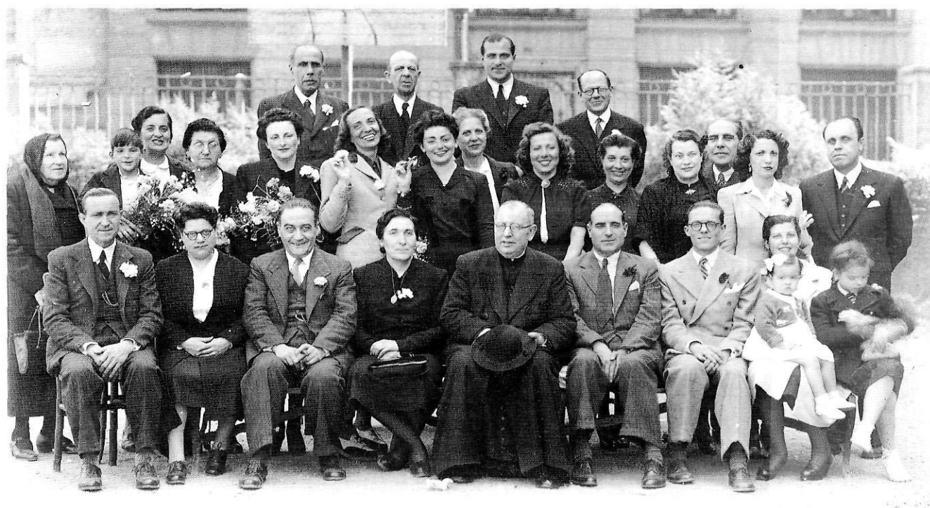
Ministral amb els companys del Grup Escolar Baixeras, de Barcelona, l'any 1950.