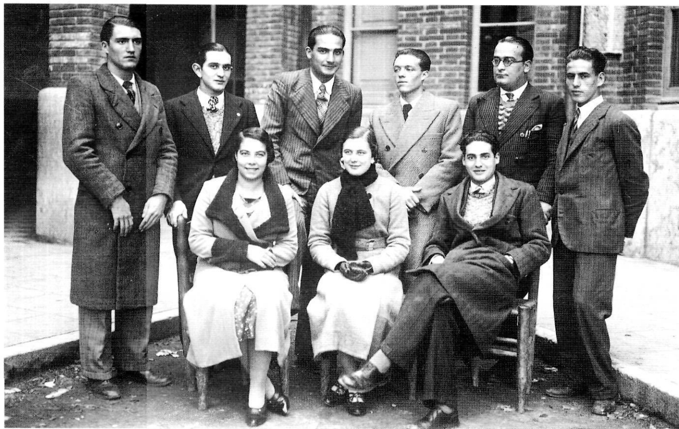
Ministral amb companys d'estudis, a l'Escola Normal de Girona.