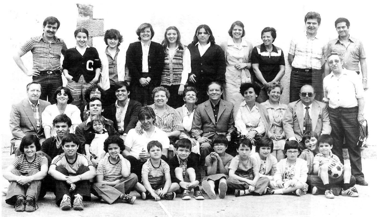
Els quatre germans Ministral, amb llurs respectives famílies, al santuari dels Àngels, l'any 1978.