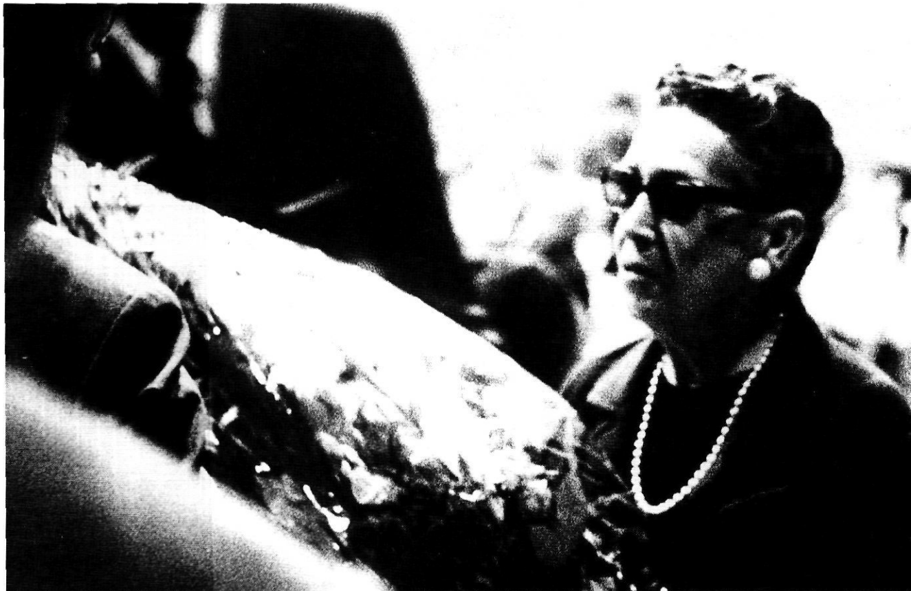
«Em plau que sigui Girona qui convoqui un premi amb el nom del meu pare».