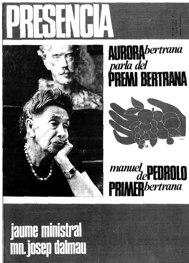
Portada del número 205 de Presència, del 7 de juny de 1969.