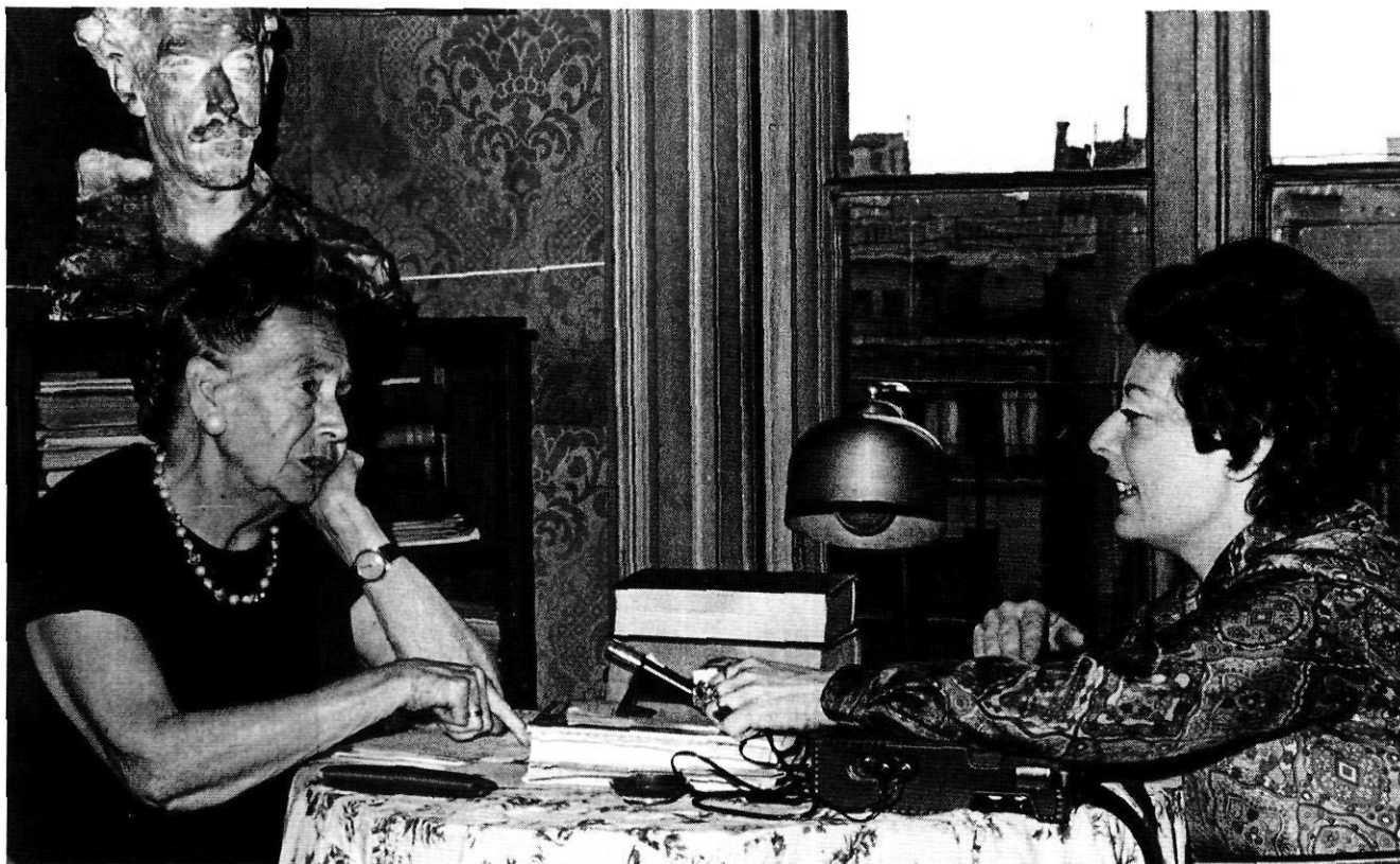
L'escriptora al seu domicili barceloní del carrer de Lhúria, 4, en un moment de l'entrevista amb Mireia Xapellí per a Presència, 1969.