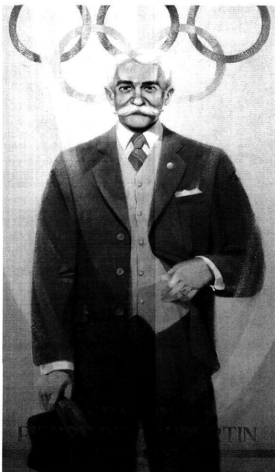
«Pierre de Coubertin», oli sobre tela de Xavier Carbonell.

Els temes i els elements que configuren aquest conjunt s'han inspirat en definicions i textos del mateix fundador del moviment olímpic modern. L'honor es correspon a: «Els títols que confereix l'esport no tenen cap valor si són assolits amb la més absoluta lleialtat i un perfecte desinterès» (fragment d' Oda a l'esport , 1912). Xavier Carbonell va escollir per a aquest oli el lema clàssic del Jocs antics: « Citius, altius, fortius » i igualment elements de l'art grec. La solidaritat olímpica s'inspira en la frase: «La vida és solidària perquè la competició és solidària» ( La novel·la d'una adhesió , 1902). Carbonell pinta dos esportistes de races diferents que junts aixequen la torxa, mentre, de fons, es veu el lliurament del testimoni de les curses: «Esport, tu ets la pau!» ( Oda a l'esport , 1912), amb aquesta frase de rerefons, Carbonell escollí per a aquesta obra temes simbòlics, el colom i les anelles olímpiques que