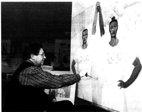
L'artista pinta l'oli «Solidaritat» al seu taller olotí.