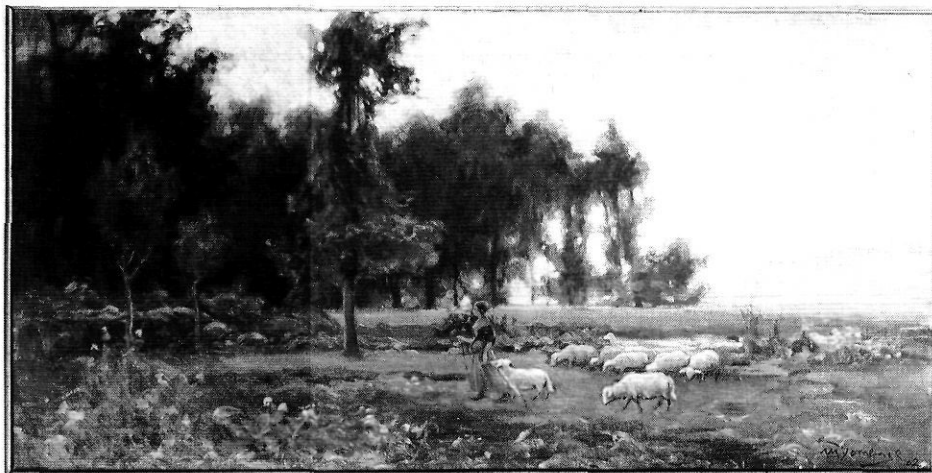
Dos paisatges característics de Melcior Domenge exhibits a l'exposició d'Olot.

El 1900, Alfred Opisso diu que pintar paisatge a plein-air és senyal d'un temperament que en podríem dir modern . També diu: «El paisatgista és el retratista de la naturalesa i ha d'entendre els trets psicològics d'aquesta, com si es tractés d'una figura humana; no ha de ser un fotògraf sinó un vident». Aquest pensament d'aprofundir la