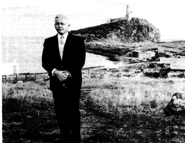
Vicens i Vives a l'illa de Sardenya.

alumnos de primer curso de Bachillerato una introducción fácil y amena al conocimiento de la Geografía de España... el muchacho de 10 a 11 años se muestra en general incapaz de digerir cuanto le propone en extensión el programa oficial. Su fatiga se traduce en un lento apartarse del quehacer geográfico, en perjuicio de los altos fines humanos y sociales de esta disciplina. Para evitar tal escollo los autores han reducido los conocimientos geográficos que se pretenden enseñar a los esquemas más esenciales... Pero esto implica por parte de Profesorado una adecuada preparación pedagógica, que evite que el alumno haya de aprenderse de memoria el texto» (Vicens i Sobrequés, 1959, p.s.n.).