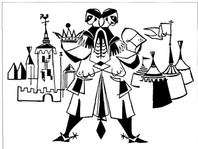
«La crisi del segle XV». Il·lustració de J. M. Rovira per al llibre de Vicens i Vives Aproximación a la Historia de España (Barcelona, 1952).

que revocava l'anterior abolicció dels mals usos d'Alfons V (Sentència interlocutòria del 1455), a canvi d'un generós donatiu de 300.000 lliures. La mesura no és poc important perquè sembla ser el motiu de la revolta de Pere Joan Sala, tres anys més tard. Malgrat la distància cronològica és interessant comparar aquesta política amb la que Jaume I va desenvolupar molt abans per impulsar les institucions municipals. L'actuació d'aquest rei no sembla el resultat d'una pressió popular sinó més aviat una iniciativa destinada a millorar la coordinació amb les elits locals que podien procurar-li diners (5).