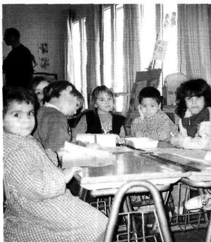
L'escola de Pau ha crescut gràcies a l'arribada d'immigrants de la UE i del continent africà.

També hi ha pobles que poden quedar-se sense escola arran del desinterès de l'alcalde/essa o, millor dit, a l'interès que aquest/a té perquè l'edifici escolar es converteixi en un local social, en una emissora municipal, o en l'ajuntament del poble, etc.