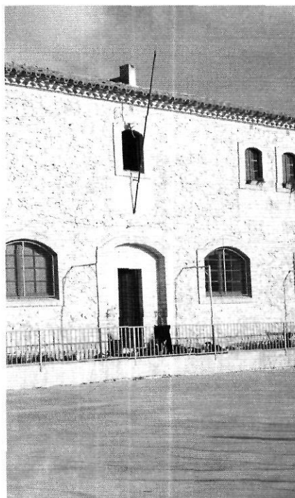
L'escola rural de Vilanant.

D'altra banda, també hi ha influït el desencantament social i humà que s'està produint en moltes ciutats. Aquesta