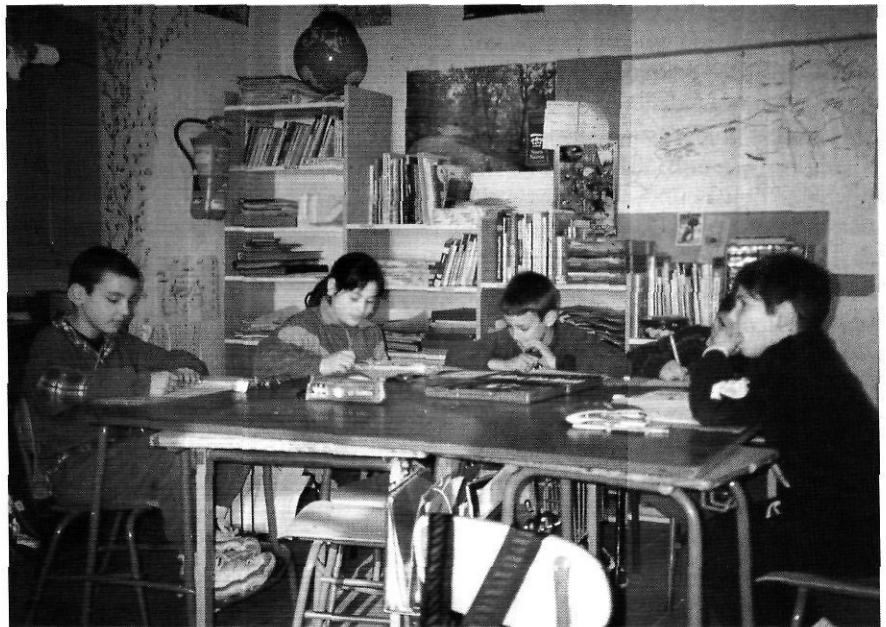
A l'escola de Vilanant són pocs, però ben avinguts. La classe dels «grans».

Diversos mestres i pedagogs han convingut a afirmar que els centres petits (entengui's les escoles rurals) són models organitzatius ideals per a dur a terme una activitat escolar més íntima (arran del poc nombre d'alumnes), més humana i més familiar i més personalitzada (perquè el mestre tracta d'una manera particular a cada alumne amb l'objectiu de respectar la seva idiosincràsia).