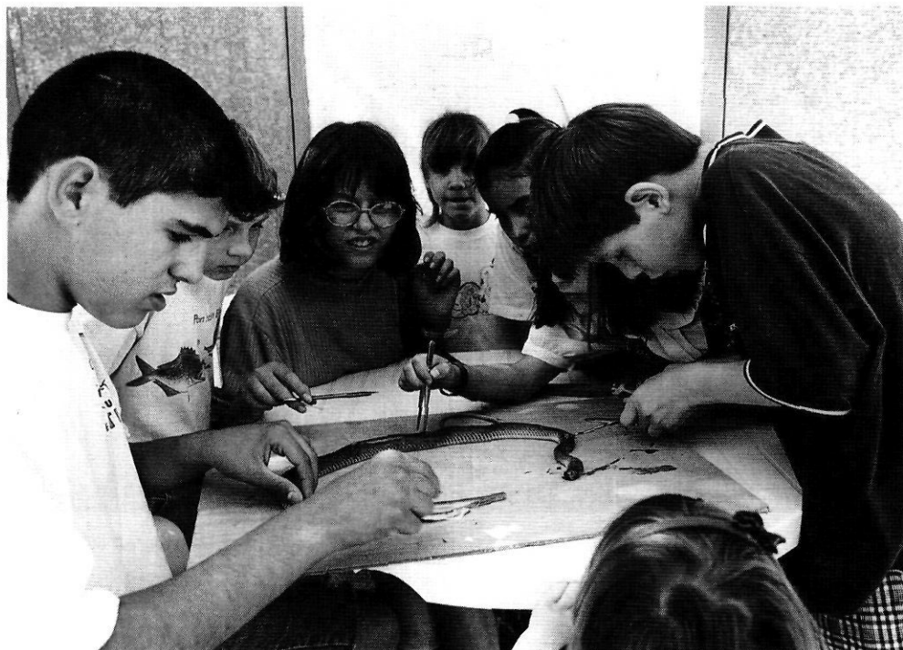
El descobriment dels rèptils el fan tots els alumnes de l'escola: els «grans» i els «petits».