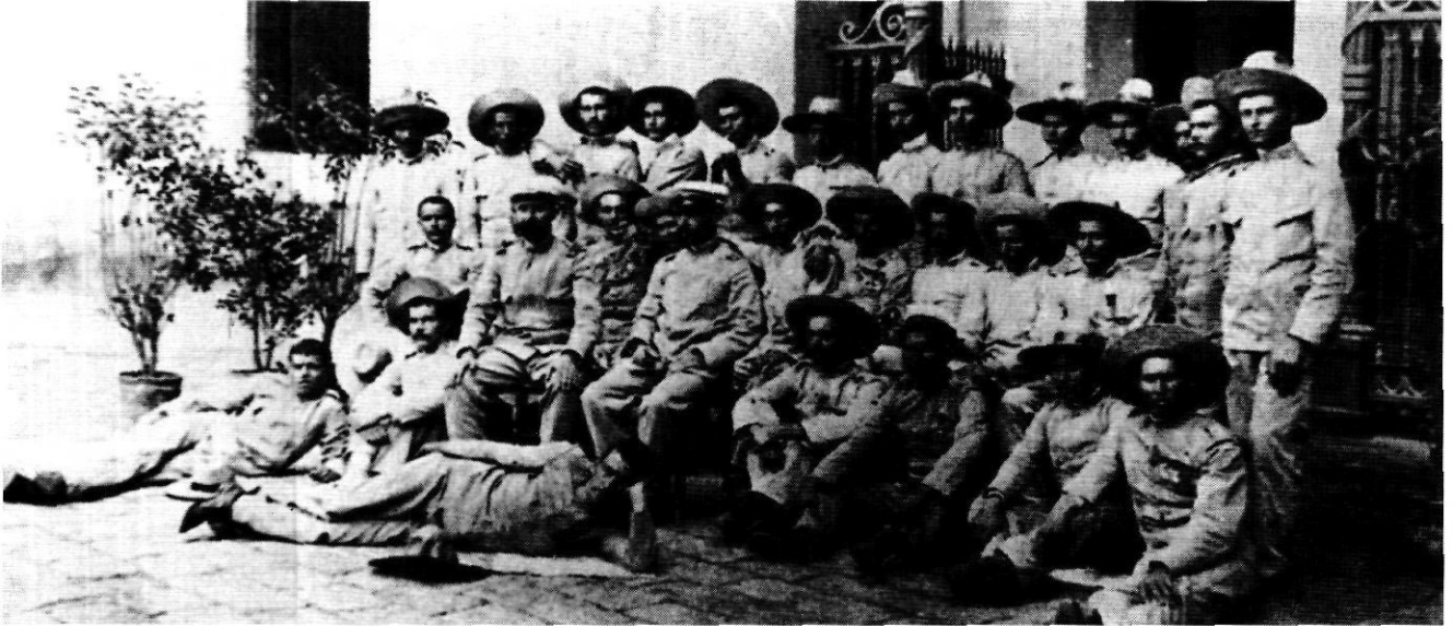
Els supervivents del setge de Balaguer. Entre ells hi ha un gironí.

de Sant Joan de les Abadesses, serraller de professió. Dos catalans més figuren a la llista de supervivents: un barceloní de Sant Feliu de Codines i un lleidatà.