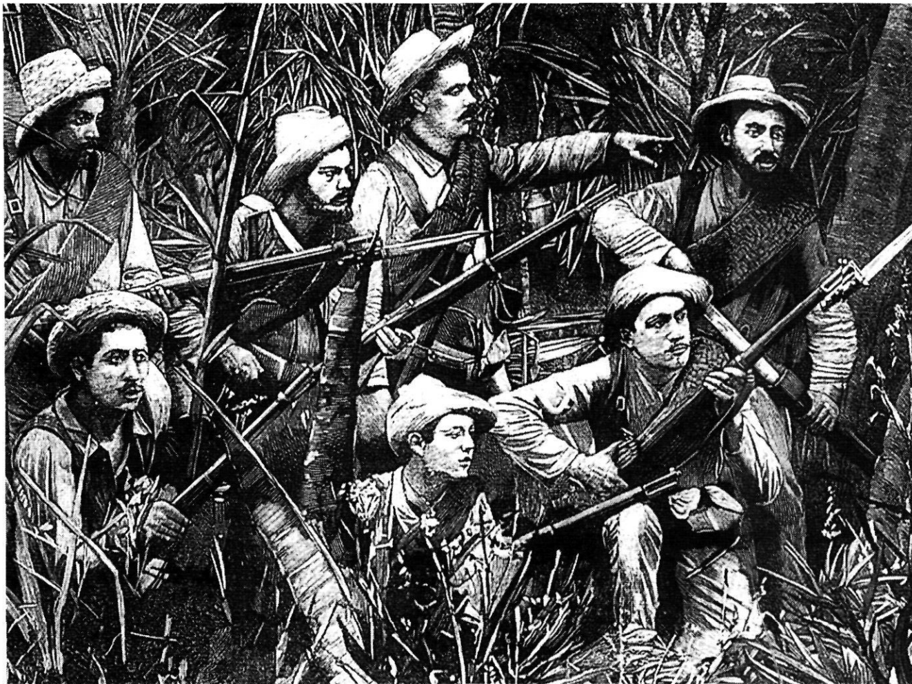
La guerra de Cuba en un dibuix de premsa de l'època.

zar àmpliament els fusells Mauser, superiors, per exemple, als Remington reglamentaris a l'exèrcit nord-americà. En canvi, quasi no disposaven de metralladores i de canons de campanya, i l'artilleria de costa era antiquada. Per exemple, en el port de Santiago hi havia quatre canons de 1724!