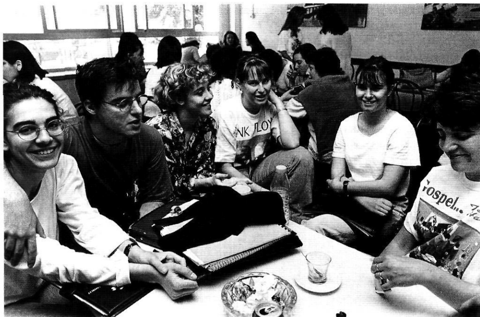
Reportatge de JOSEP M. OLIVERAS

Durant l'última dècada s'ha fet palesa la necessitat d'adaptar l'educació universitària a les exigències del mercat de treball.