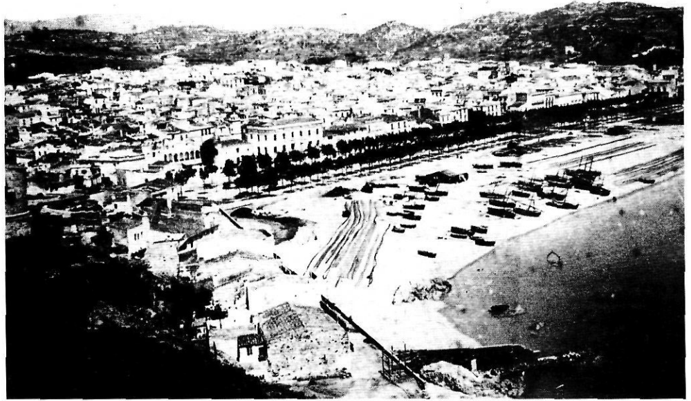
Sant Feliu de Guíxols en els anys de celebració del certamen literari.