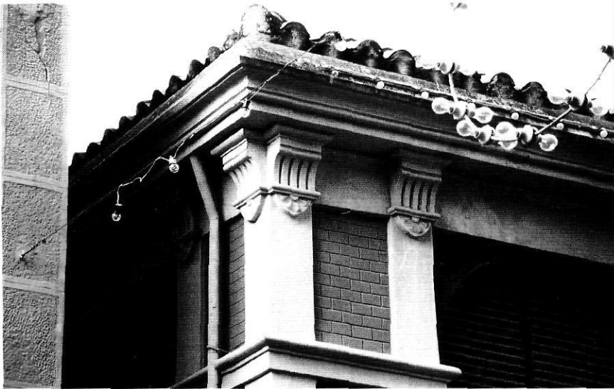
Detalls constructius i ornamentals de l'edifici del Mercat.

cament mural integral amb elements arquitectònics i materials tradicionals.