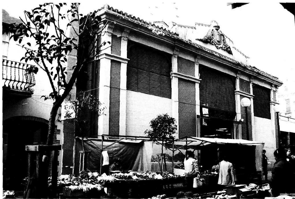
El mercat cobert de Palafrugell, inaugurat l'any 1901.