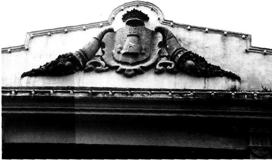
Escut de Palafrugell i corns de l'abundància, a la façana principal del Mercat.

al mestre d'obres Ceferino Carré Sala, de Figueres, el 13 d'octubre del 1900, per un total de 25.811 pessetes(8). Carré es proveí de bigues i d'elements estructurals de la coberta a la Sociedad Material para Ferrocarriles y Construcciones de Barcelona(9). L'edifici fou inaugurat l'any 1901, com apareixia indicat a la façana abans de la restauració, per l'alcalde Joan Vergès i Barris.