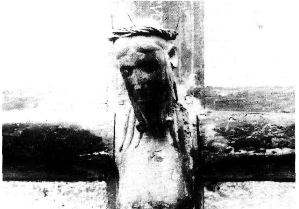
La Majestat de les Planes del Museu de Vic (a la fotografia) i el «Sant Cristo Gros» de les Planes d'Hostoles són dues imatges completament distintes.