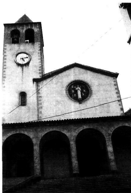
L'església parroquial de Sant Cristòfol de les Planes d'Hostoles.

Fou membre de l'Associació d'Excursions Catalana i del Centre Excursionista de Catalunya i col·laborà assíduament en els seus butlletins respectius. Morí a Barcelona, l'any 1915.(2)