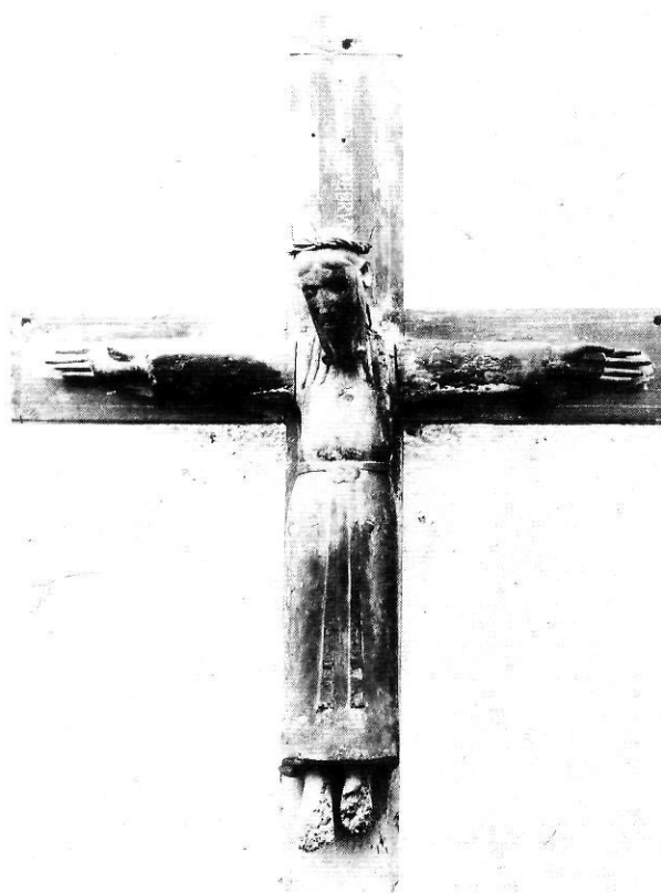
La Majestat que, procedent de les Planes d'Hostoles, es troba avui al Museu Episcopal de Vic.

La posició del cap no creiem que sigui totalment correcta. Tenim fotografies antigues on es veu molt clar que aquesta imatge, com succeï a altres Majestats, fou decapitada per tal de