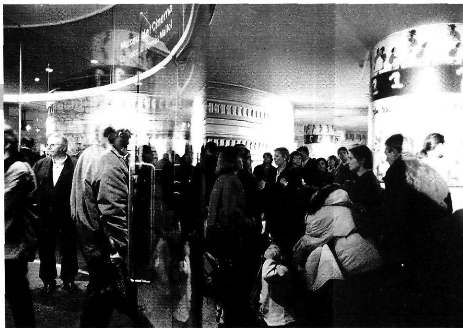
El vestíbul del Museu durant l'acte inaugural.

molt ràpidament per la lent del projector, i els ninots del zoòtrop, i el sol i la lluna en els panorames, que permetien passar del dia a la nit en pocs segons tapant-los o exhibint-los alternativament contra la llum. No en fèiem prou, de veure-hi; volíem conservar el que vèiem, i un cop retinguda la imatge, volíem transformar-la.