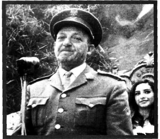
El general Emerio Felíu Oliver, governador militar de Girona, protagonista dels fets del Corpus de 1969.

Un altre escrit de la Hoja Parroquial , aparegut el 27 d'abril, va ser objecte d'atenció especial i de reacció en contra del bisbat. Es titulava «Hoy, la Moreneta», i s'hi afirmava: «Nadie puede negar que nuestra región tiene unas