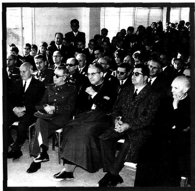
Amb autoritats provincials i locals, en un acte celebrat a Palafrugell, l'any 1966.

«aconsellaren» que la pàgina on se'n parlava, i es demanaven explicacions, fos impresa de bell nou amb un altre text. La resposta, tanmateix, arribà, el mes d'agost, per mitjà de la revista Fuerza Nueva , on el prelat era víctima d'un atac frontal, acusat de no saber mantenir la disciplina ni l'ortodòxia tradicionals: