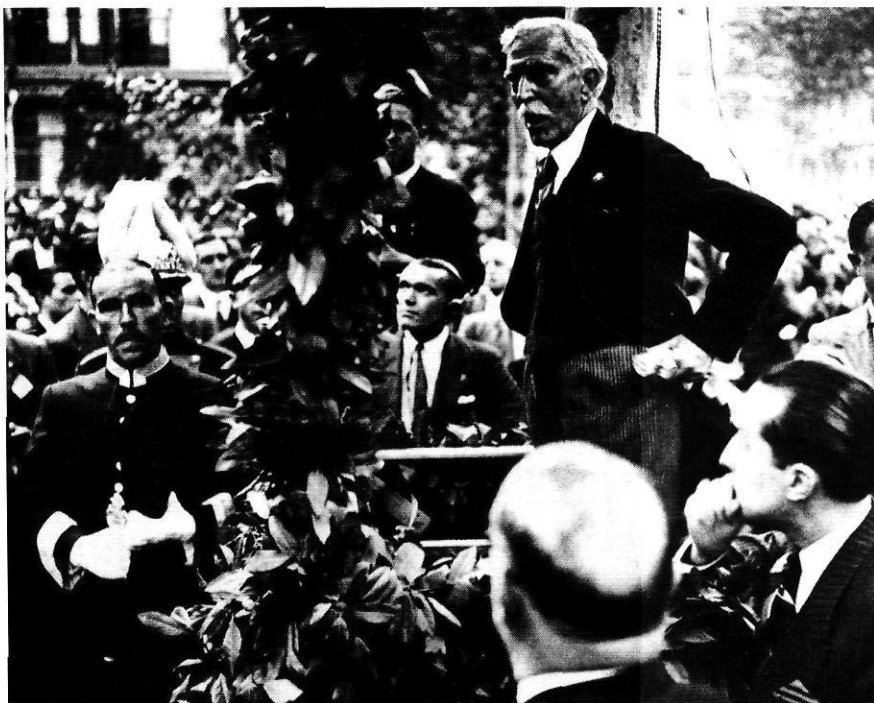
El president Francesc Macià a Barcelona, l'11 de setembre de 1933.