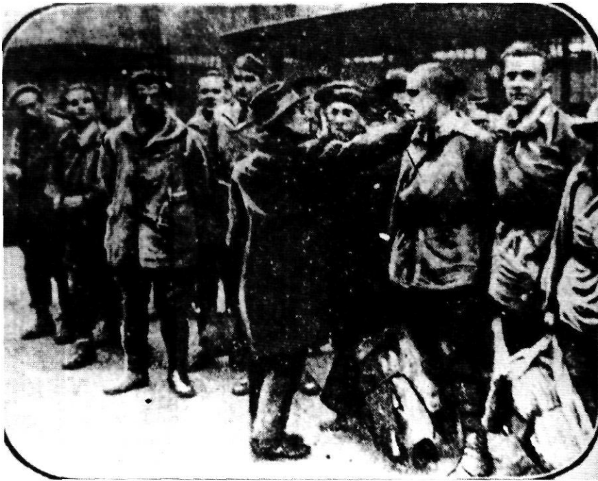
Un policia francès compta els presoners, després dels fets de Prats de Molló.

4 de novembre de 1930. Va entrar per Portbou, on fou detingut, ja que l'amnistia decretada pel nou Govern no l'inclouïa puix es trobava en edat militar. Fou reclòs a la presó de Figueres fins al 16 de febrer següent que el traslladaren a la Model de Barcelona. Més d'un centenar de figuerencs el van acomiadar a l'estació alhora que s'havia fet un escrit al president del Govern demanant el seu indult signat per quatre mil veïns. Finalment fou alliberat el 14 de març de 1931. El van nomenar professor de matemàtiques de l'Escola de preaprenentatge i professor adjunt de l'Escola de matemàtiques.