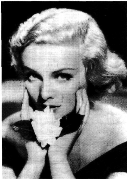
L'actriu en els seus anys de glòria cinematogràfica.

estudis americans, on, per espai de més de 15 anys, va ser una primera figura als platós de Fox, Paramount o Selznik. Amb The Fan , adaptació de El vano de lady Windermere , d'Oscar Wilde, no estrenada comercialment a casa nostra, va dir adéu al cinema. Era l'any 1949. Carroll havia ja traspasat la ratlla dels 40 anys. En els crèdits d'aquella pel·lícula ja no encapçalava «el cast». El primer lloc se l'emportava Jeanne Crain, una joveneta que llavors començava a destacar com una novetat dels estudis Fox. Potser la por de ser «plat de segona taula», o les traïdores primeres arrugues, la varen fer decidir. Per altra banda, sembla que estava econòmicament ben situada. El seu mutis d'un món de ficció (i enveja) va ser definitiu, com anys abans ho havien fet la Shearer i la Garbo.