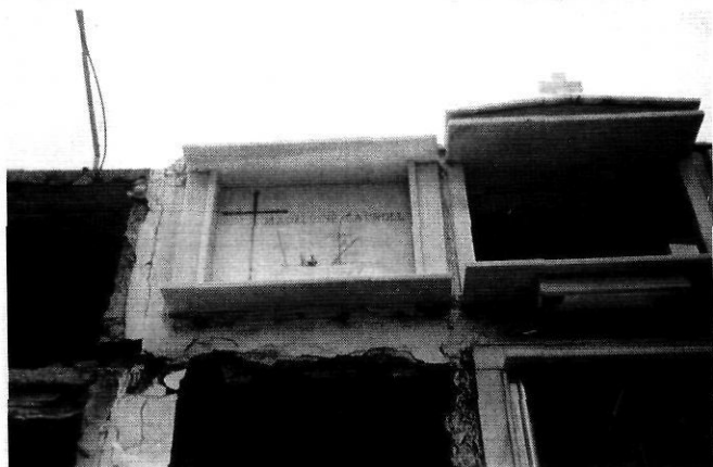
La tomba de l'actriu, enmig de nínxols buits, al cementiri de Fuengirola.