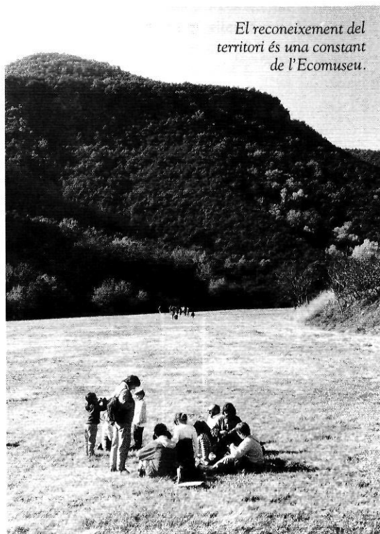
El reconeixement del territori és una constant de l'Ecomuseu.