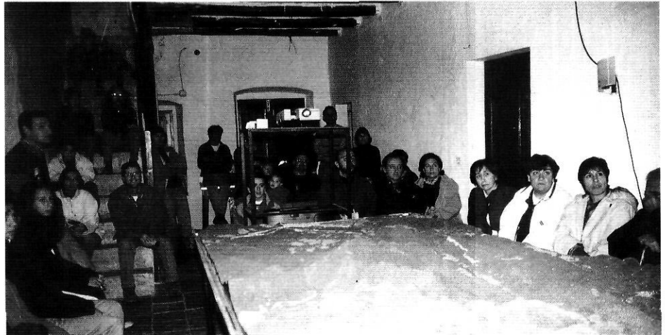
Les característiques de l'equipament afavoreixen l'escalf popular.

I és curiós que les referències d'ecomuseus a Catalunya tinguin relació amb les valls. Són les conques de les mans acollidores: el primer neix a les Valls d'Àneu, al Pallars Sobirà; el segon projectat era a la Vall de Ribes; l'ecomuseu de la Vall de Llémna, des del 1994 té una absoluta definició d'objectius i els està realitzant amb una col·lectiva il·lusió. Emplaçat a l'antiga rectoria de Cartellà, al terme municipal de Sant Gregori, està portant a terme diversos fòrums i seminaris, participació a cursos, publicació dels «Plecs de la Vall de Llémna». Els objectius ambiciosos tenen un exemple en el treball de restauració de la pròpia seu, un casolot que torna de mort a vida gràcies als ateneïstes que ells mateixos són tant de pedra picada com els murs mestres de la casa. Venen de seguida l'equipament comunitari amb voluntat educativa i científica per a identificar el territori del Llémna en perspectiva global. S'està fent ja una biblioteca amb molts centenars de volums, aportats per