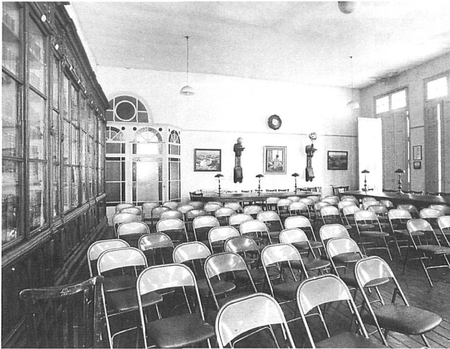
EL Casino Menestral

voluntat ha estat, al llarg d'aquests quinze anys, exercir amb modèstia i rigor alhora el rol d'una universitat popular en el sentit d'oferir una programació estable, plural i fefaent. Amb totes les nostres limitacions econòmiques, d'infraestructura i personals. Però també amb la convicció de la validesa d'un projecte que ha anat cristal·litzant.