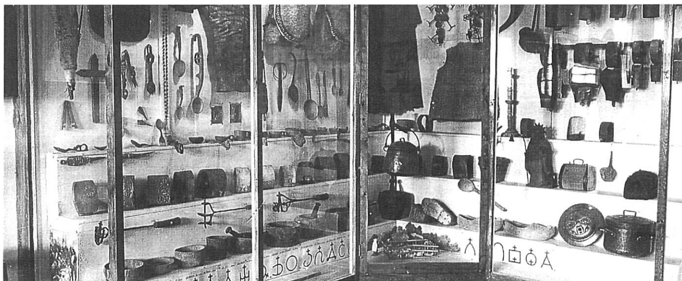
Secció d'objectes de pastors del MER.

quim Folch i Torres en un discurs fet a la plaça del mateix Poble Espanyol exposava les principals característiques que definien el nou projecte(15):