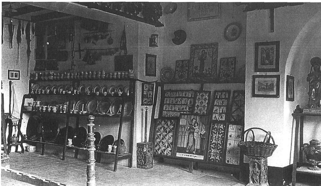
L'antic Museu Folkloric de Ripoll, actual Museu Etnogràfic de Ripoll (MER), en una fotografia de 1933.