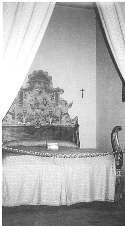
Alcova del MER.

Finalment volem fer referència a una guimbarda («samsònia» al Ripollès) que es conserva al MAITP, que no consta en els inventaris el moment del seu ingrés en el Museu, però que per dues vegades en Violant en fa referència en els seus escrits com a procedent del Ripollès. Primerament en la guia del Museu publicada el 1944(21) i més tard el 1953(22). Ens preguntem si és possible que la guimbarda que apareix a Barcelona hagués pogut ser objecte d'intercanvi amb les joguines de construcció infantil —anteriorment esmentades— en alguna de les possibles visites d'en Violant a Ripoll a l'inici de l'any 1940. La guimbarda és un instrument musical (idiòfon) de ferro, pel que sembla molt conegut antigament al Ripollès, segons Joan Amades(23), i vinculat a un ball que es feia en la matança del porc.