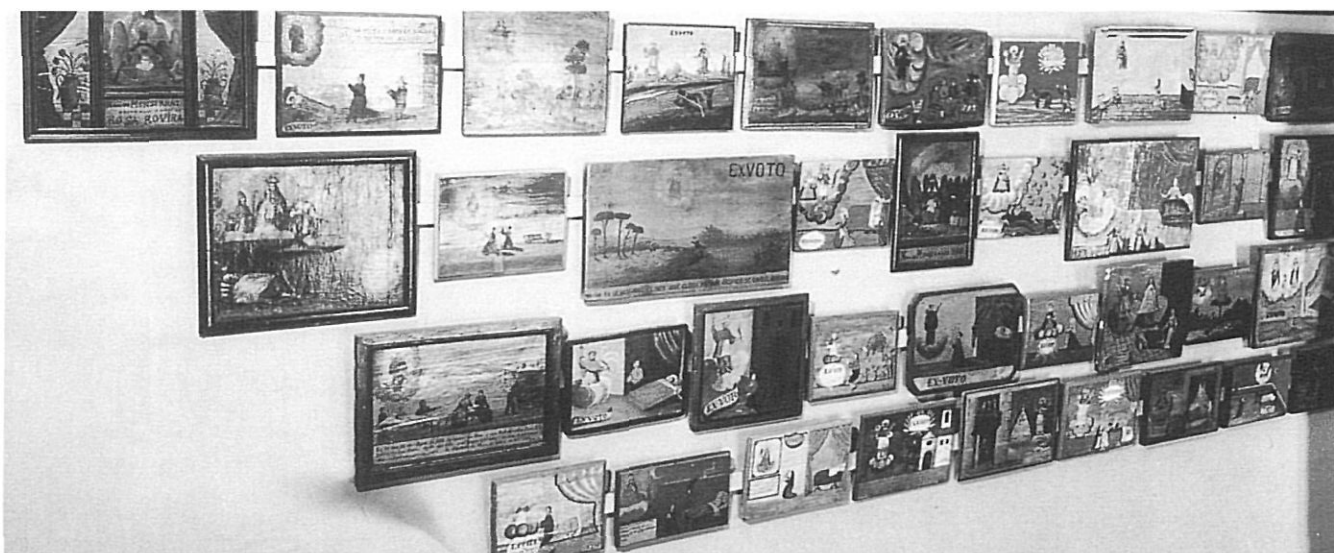
Exvots de l'antic Museu d'Indústries i Arts Populars, actual Museu d'Arts, Indústries i Tradicions Populars (MAITP).

repàs de quins van ser els inicis d'ambdós museus, les primeres etapes de formació, els seus artífexs, història i model de museu que representen.