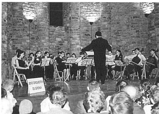
La Jove Orquestra de Girona.

De moment, però, tot just s'ha encetat el camí d'una renovació incubada des de fa molts anys i que marcarà, de ben segur, diverses generacions dels nostres músics del futur.