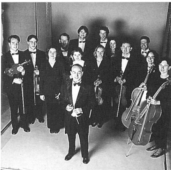
El Conjunt Orquestral de Girona.

Aquesta nova ordenació i el seu règim de permanència –força més restrictiu que l'anterior– suposaran la desaparició d'un perfil d'alumne que es veia obligat a perllongar els seus estudis musicals durant molts anys, gairebé sempre combinant-los amb altres activitats acadèmiques i completant assignatures soltes de tot el conjunt que estipulava l'antic pla d'estudis (conegut com el «Pla del 1966»), sense una ordenació correlativa en cursos per any, de manera que es podien concentrar o espaiar assignatures segons la disponibilitat horària de l'estudiant i a partir d'unes quantes disposicions normatives. Igualment, suposa un canvi per la gran quantitat d'alumnes «lliures», que només anaven als conservatoris per realitzar els exàmens de cada matèria. Amb l'aplicació de la LOGSE, només l'estudiant oficial podrà obtenir el títol de grau mitjà. Ara bé, això no vol dir que es deixi fora a tot aquell que no superi o no es presenti a la prova d'accés inicial