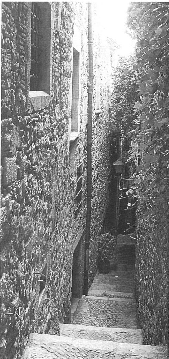
El Call jueu de Girona.