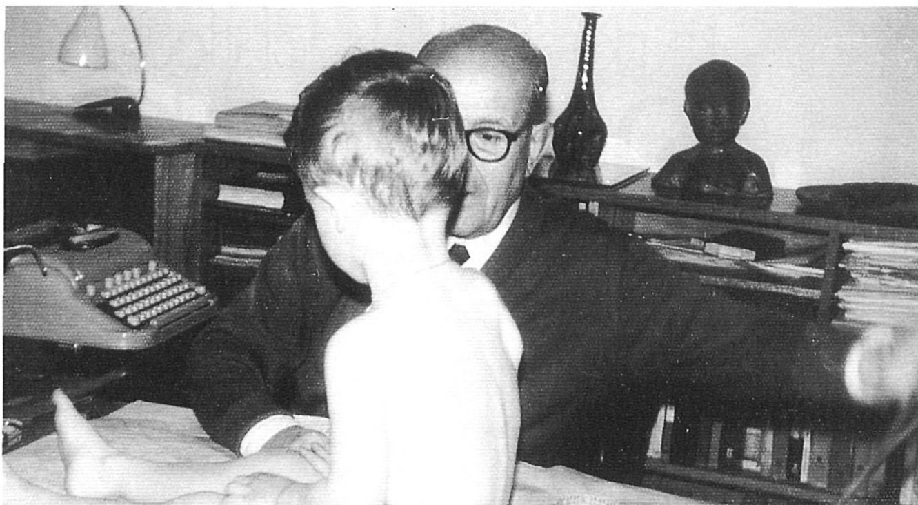
La consulta a casa seva s'alternava amb la presència als dispensaris dels barris perifèrics.