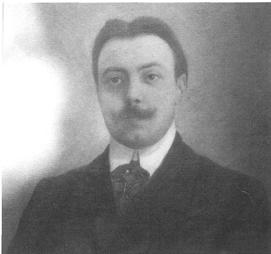
Miquel Oliva, en un retrat a l'oli de Prudenci Bertrana, de 1907.

I, de fet, aquesta és la condició que es fa ressaltar en primer lloc en les semblances i notes biogràfiques aparegudes després de la seva mort –esdevinguda el 9 de gener de 1922–, com la que s'ofereix a continuació, a tall d'exemple(8):