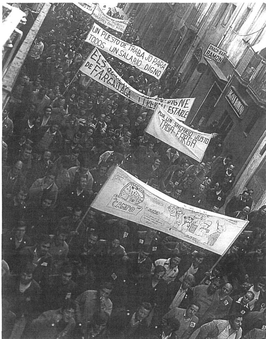
Reivindicacions salarials a les pancartes de la manifestació del 3 de febrer de 1979.