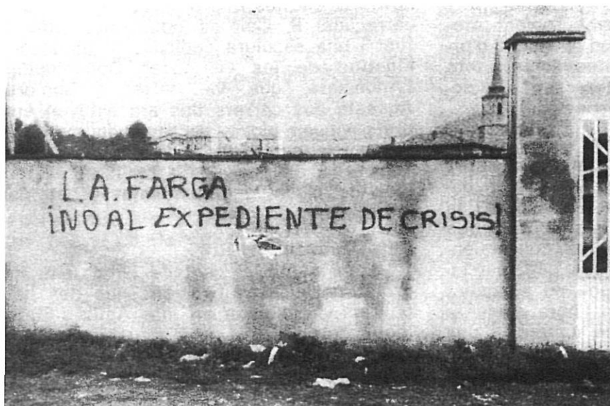
Pintada a Campdevàrol, 1977.

l'Assemblea de Catalunya l'any 1972. Això va donar lloc a la lectura d'homilies, on es mostrava el desacord amb el règim franquista. En uns moments en què no era fàcil disposar de llocs per a reunir-se, també, va ser molt important l'actitud presa per la comunitat salesiana de Ripoll que facilitava locals per a reunions de tota mena; alguns dels seus membres, com Xavier Zazo, varen estar molt compromesos en activitats de tipus social i polític (1.E4).