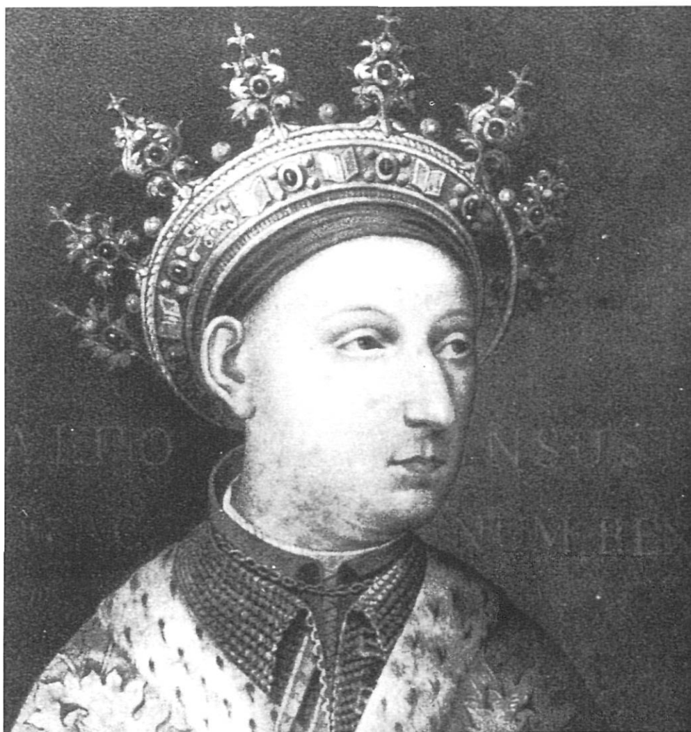
Alfons IV de Catalunya, V d'Aragó, III de València, I de Mallorca, dit el Magnànim (1396-1458)