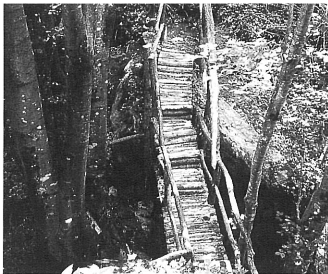
Xenacs. Les Preses.