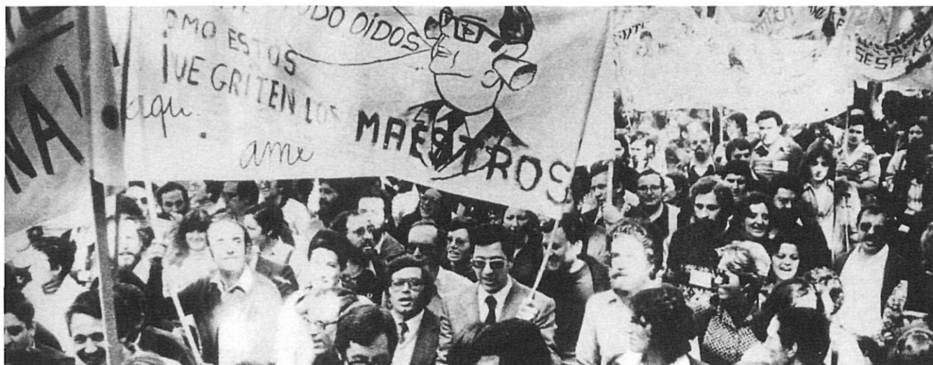
Manifestació de mestres a Barcelona, el maig de 1978.

incidència a les nostres comarques. Paral·lelament, es constitueix la primera Comissió Executiva de la Federació de Treballadors de l'Ensenyament de la UGT de Catalunya a les terres gironines que, inicialment, viu una activitat purament testimonial.