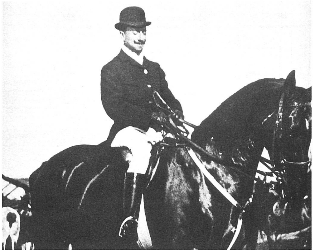
Gabriele D'Annunzio, en una fotografia de 1894.