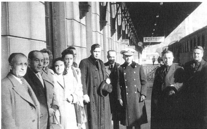
Autoritats i representacions a Portbou, el dia de l'entrada de la primera expedició.