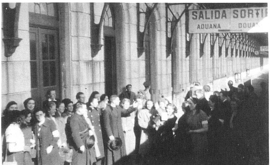
Recepció de les nenes austríaques a l'estació de Portbou.

La resta del comboi va seguir direcció a Barcelona, on arribaren a les dues del migdia. A l'estació, també les esperava el bisbe de la diòcesi, doctor