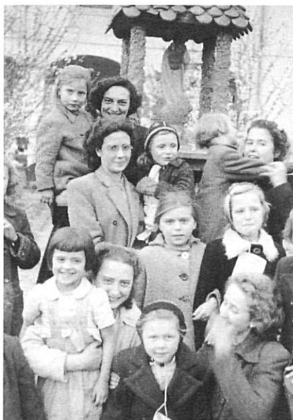
Els primers signes d'acolliment.

Per sort, l'exèrcit anglès va cedir sis vagons metàl·lics amb seients de fusta per a la primera expedició. Després de l'eufòria d'haver aconseguit el mitjà de desplaçament, els va sorgir un nou inconvenient: Espanya, l'últim reducte del feixisme, no tenia relacions diplomàtiques amb Àustria, per la qual cosa era impossible una entrada massiva de persones procedents d'aquell indret, encara que es tractés de mainada i que