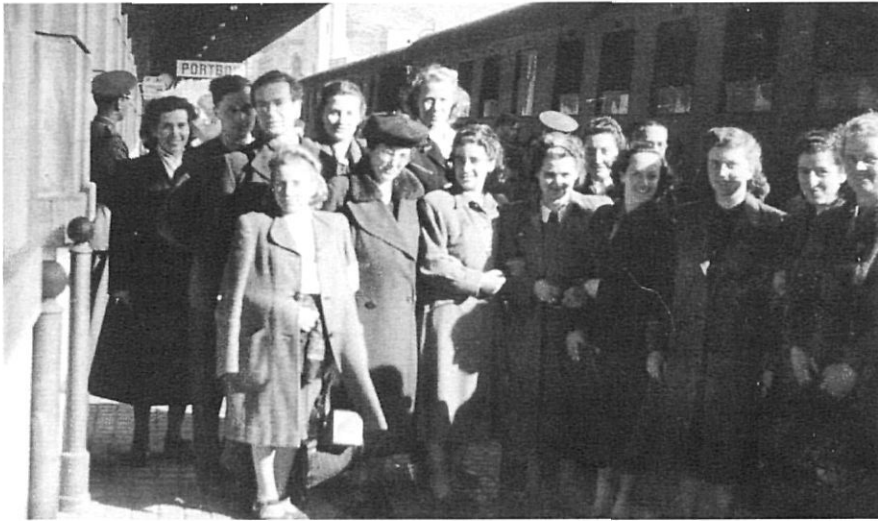
Acompanyants de les nenes amb membres de famílies acollidores.