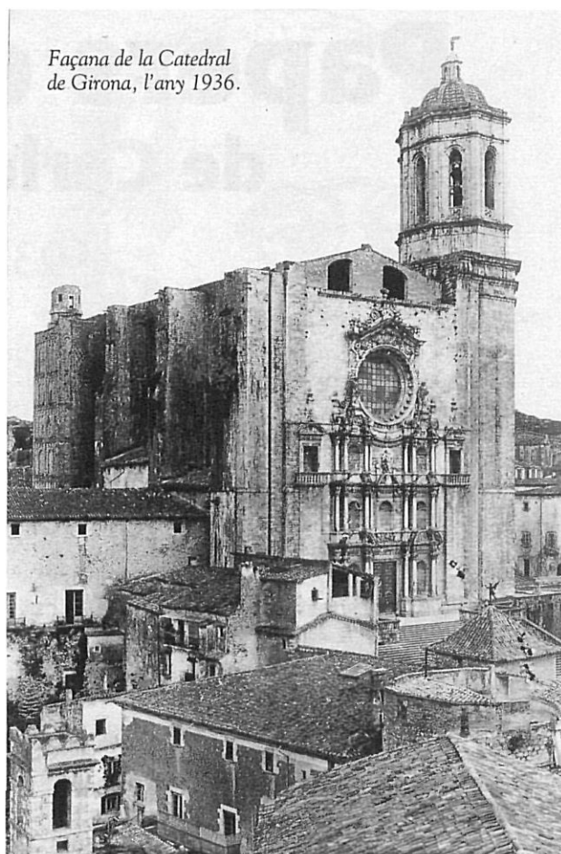
Façana de la Catedral de Girona, l'any 1936.