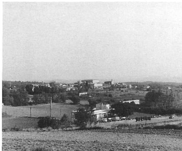
Orriols, al peu de la carretera de Girona a Figueres.