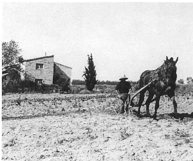
Feines agrícoles tradicionals a Orriols.