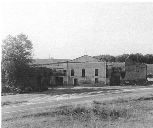
Can Perruca, seu del Comitè d'Orriols.

hombres honrados se dispongan a ponerse a la altura de las circunstancias y que no sea abandonado el problema social, moral y material». I més endavant afegien: «No es cuestión de oportunismo sino de responsabilidad que todos ofrecen de buen corazón»(4).