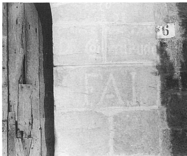
Sigles de la FAI, a la mateixa porta d'Orriols.

utilització dels seus serveis pels particulars sense cap despesa, que era abonada posteriorment pel comitè.