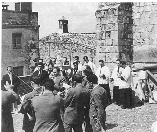
Processons de postguerra a Orriols.