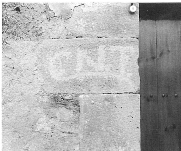
Sigles de la CNT, encara visibles en una porta d'Orriols.