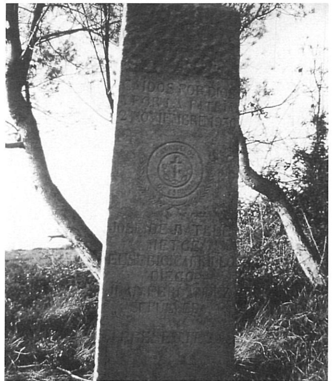
«Caídos por Dios y por la Patria...»

Així, l'imaginari popular, forjador en darrer terme del mite Orriols, conjuntament amb bona part del discurs historiogràfic, només han sabut mostrar una vessant violenta i terrorífica marcada per l'acció repressiva. D'aquesta manera s'atribueix la responsabilitat dels actes