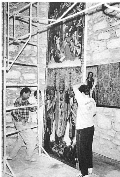
El "nou" retaule de Púbol retorna al seu lloc original.

explica l'autor, va ser el Llençol Sant que es guarda a la catedral de Torí i els estudis que s'han fet de la figura que va embolcallar. Ansón va analitzar la mort dels crucificats, que era per ofec, i tots els detalls anatòmics necessaris per assolir el seu objectiu.