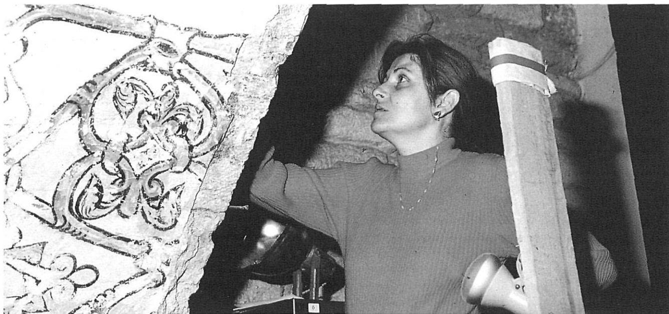
Resturació de pintures gòtiques. MACB, 1992.

No amagarem pas que aquests museus locals o comarcals, normalment propis de comunitats mitjanes o petites, que es basaven en la recuperació de materials variats del seu territori (arqueològics, històrics, paleontològics, artístics o de ciències naturals), han entrat darrerament en un període de crisi. La relativa categoria d'algunes de les peces exposades en comparació amb als grans museus nacionals de Barcelona i sobretot la impossibilitat de competir amb els seus supermilionaris muntatges museològics han fet somoure la tradicional fidelitat del públic local i escolar.