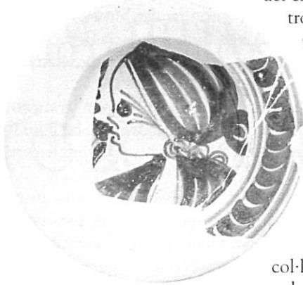
Plat resturat, segle XVII. Monestir de Banyoles, MACB.

del camp de la recerca o de la docència, sense una preparació específica. En algun cas es trobaren amb col·leccions prèvies importants i en altres les varen començar a formar.