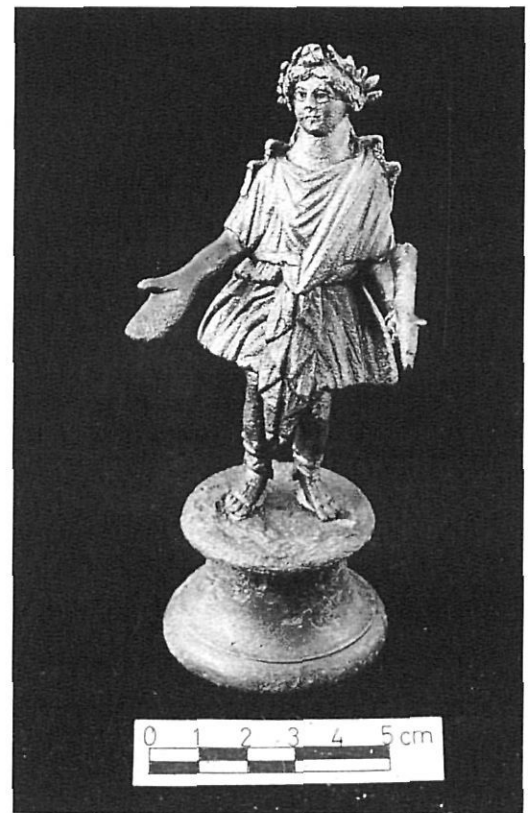
Lar de bronze (Viluba), després de la seva restauració.

No deixa de ser simptomàtic que la nova Llei de Museus de la Generalitat (1990) hagi previst la necessitat de crear els Serveis d'Atenció Museística (SAM), especialitzats en la