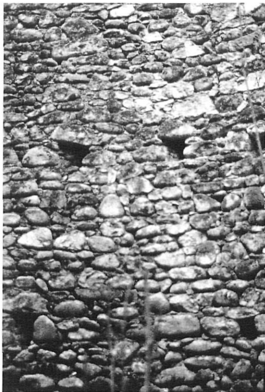
Detall exterior del pou de glaç de Vilanna (Besanó).

Que els seus municipis es beneficiïn de l'interès general cada cop més gran cap als temes culturals i naturals.