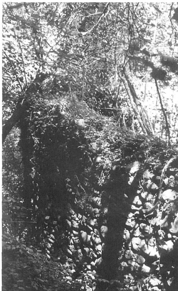
Detall interior del pou de glaç de Vilanna (Bescanó).

aquest patrimoni més «petit» però no per això menys important.