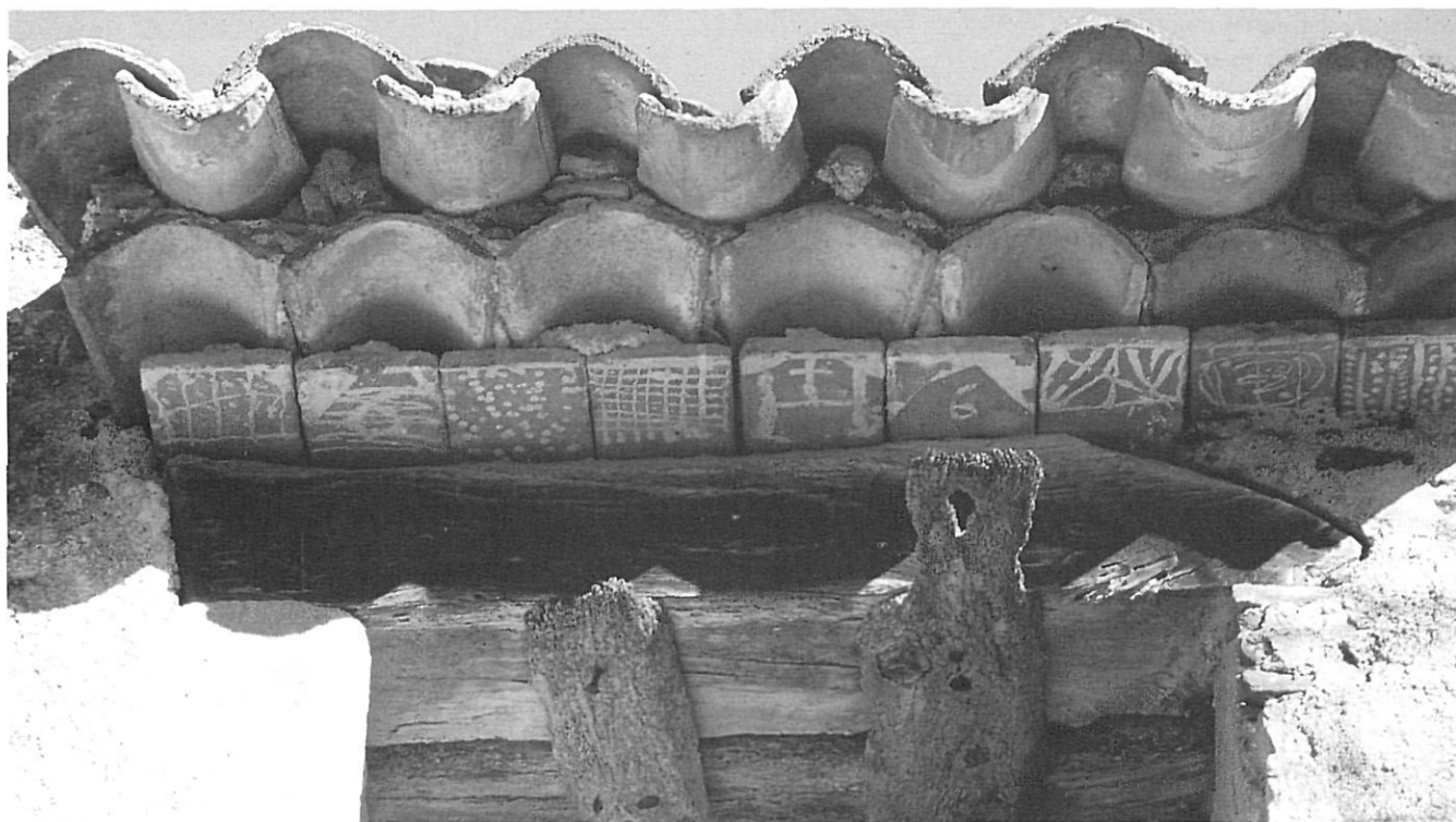
Molí d'en Ribes (Sant Sadurní de l'Heura). Detall d'unes teules pintades. Hom creia que aquestes teules exercien protecció sobre la farina.

Quan sentim notícies en els mitjans de comunicació parlant de «delictes ecològics» no se'ns fa estrany, i fins i tot podem arribar a entendre les conseqüències i els càstigs que es poden aplicar. En canvi, el «delicte cultural» de fet no existeix, no és una notícia que mereixi titulars importants en els mitjans de comunicació, entre altres coses perquè la