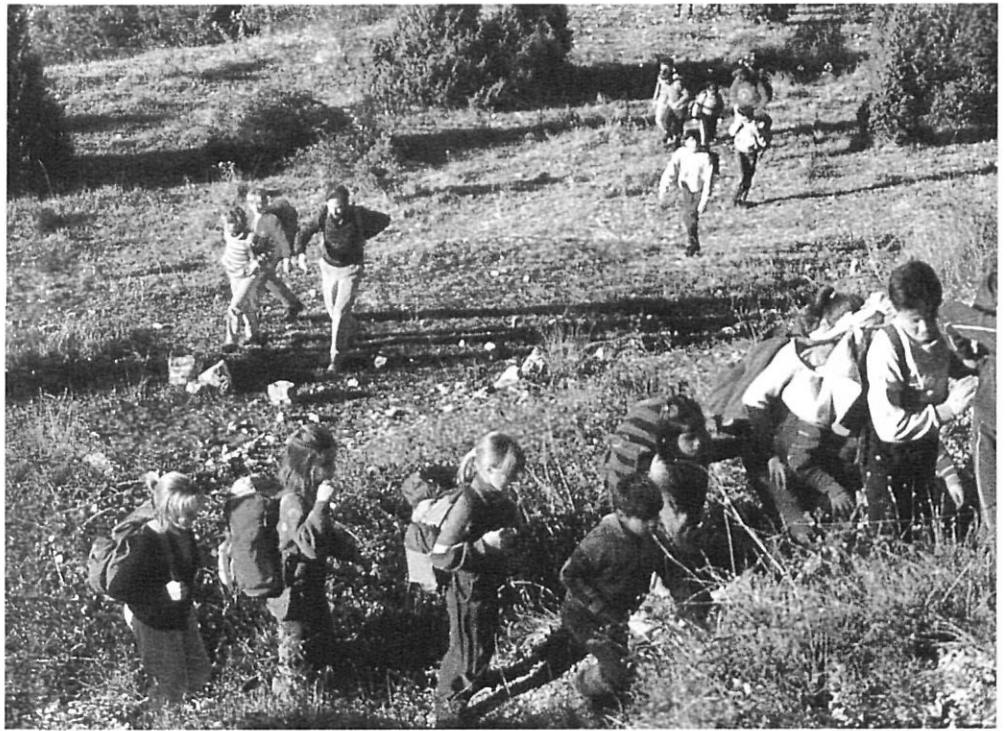
«Proposem refer una cultura social que valori l'ensenyament i el lideri amb entusiasme». (IV Jornades dels MRP de Catalunya, Lloret de Mar, 1992).