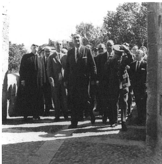
Inauguració de la restauració del pont de Besalú, 1965.

que dipositi un nombre determinat de volums a les llibreries. Cal transformar el distribuïdor en delegat comercial de l'editor en l'espai geogràfic que constitueix el mercat objectiu. Ha d'esdevenir el promotor de l'editorial, en una tasca que seria cultural i comercial alhora.