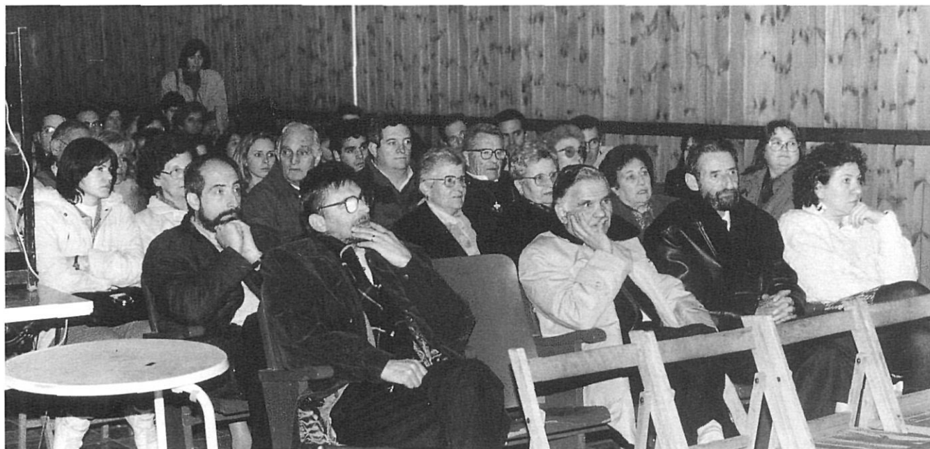
Presentació dels Annals del Ripollès al cercle Capdevanolenc, 1996.

ca dins la pràctica i la teoria historiogràfiques. Ningú no posa en dubte el seu interès per entendre i estudiar la macrohistòria temàtica (vida quotidiana, història del transport, de la indústria..., per posar uns pocs exemples).