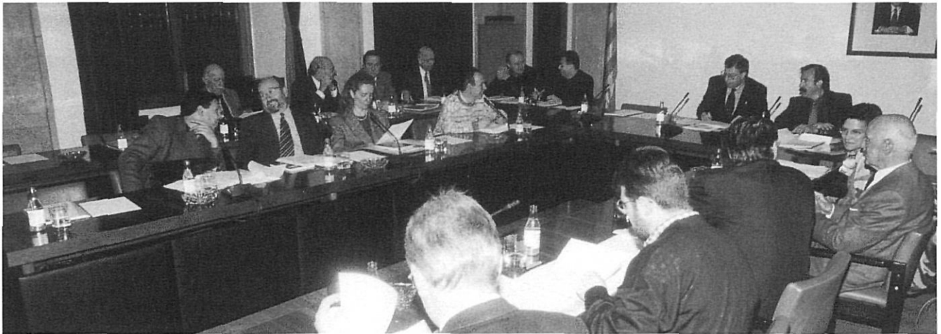
Sessió constitutiva de l'Organisme Autònom Local "Patronat Francesc Eiximenis", Girona, 15-3-97.

ya, Amics de Sant Joan les Fonts i Amics del Vescomtat de Bas-, Associació Arqueològica de Girona, Institut d'Estudis Ceretans, Centre d'Estudis del Ripollès, Institut d'Estudis del Baix Empordà i Centre d'Estudis Selvatans. La darrera entitat a incorporar-se va ser el Cercle d'Estudis Històrics i Socials de Girona, l'activitat del qual se centra en la història contemporània en l'àmbit de les comarques gironines. Al seu torn, van formar part també del Patronat—fins a la recent segregació coincidint amb l'obertura d'aquesta època que ara engega— el Centre d'Investigacions Arqueològiques de Girona i la Universitat de Girona, abans Col·legi Universitari.