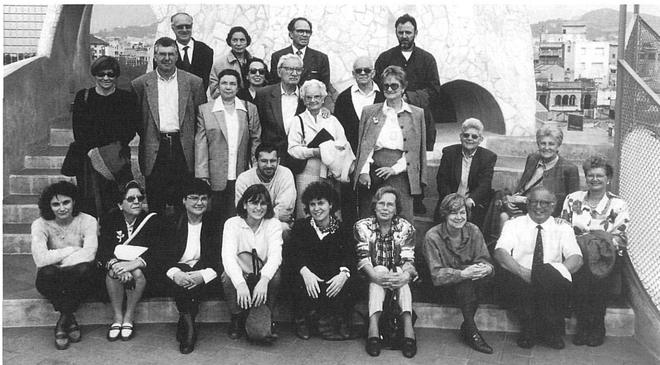
Centre Estudis Comarcals Banyoles. Visita a la Pedrera, Barcelona, 1996.

dis i cada un respon a unes necessitats particulars. El contacte entre ells ha estat permanent des de sempre: per exemple, els intercanvis de publicacions són una pràctica molt estesa, però totalment insuficient. Fa falta organitzar activitats comunes i impulsar debats generals que consolidin els centres d'estudis. Com a fruit d'aquesta col·laboració s'enfortiran i s'aprofundirà en la qualitat i abast de les seves aportacions culturals i científiques.