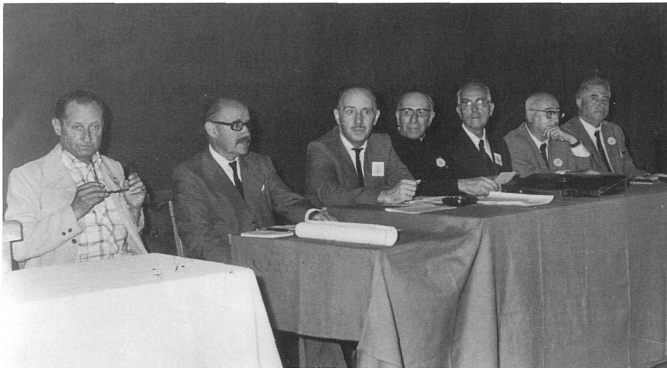
Patronat d'Estudis Històrics d'Olot i Comarca. Assemblea de l'any 1972.

caràcter territorial és, per si mateix, una aportació a l'extensió cultural i científica que la universitat no ha pogut portar a terme. A més, també cal afegir que des dels centres d'estudis s'han realitzat investigacions que han contribuït a explicar, de manera descentralitzada, la realitat present i passada de Catalunya. Si sovint les explicacions d'aquesta realitat han donat preferència a la ciutat de Barcelona, els centres d'estudis han permès territorialitzar i tractar la importància de la resta de Catalunya.