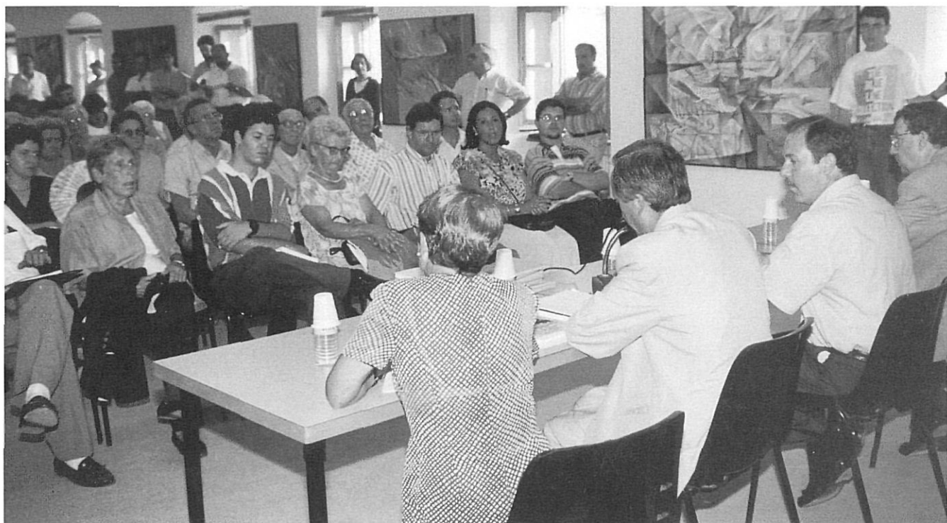
Presentació del volum 14 de l'Institut d'Estudis del Baix Empordà. Sant Feliu de Guíxols. 1995

explicar la diversificada funció cultural i científica que tenen aquestes entitats.